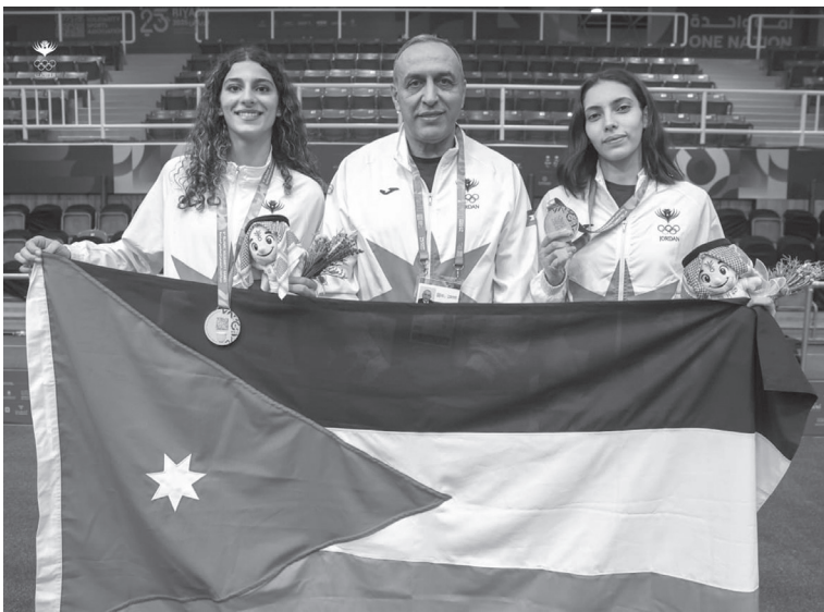
الأبطال - عمان

(بترا)، اختتمنا يوم أمس الاثنين، المشاركة في دورة ألعاب التضامن الإسلامي التايكواندو وفير من الميداليات بلغ ه ميداليات، ونستعد لمشاركات خارجية مهمة أيضاً وقريبة نطمح من خلالها مواصلة تحقيق الإنجازات. وبين العبدلات، أن اللجنة الأولمبية الأردنية برئاسة سمو الأمير