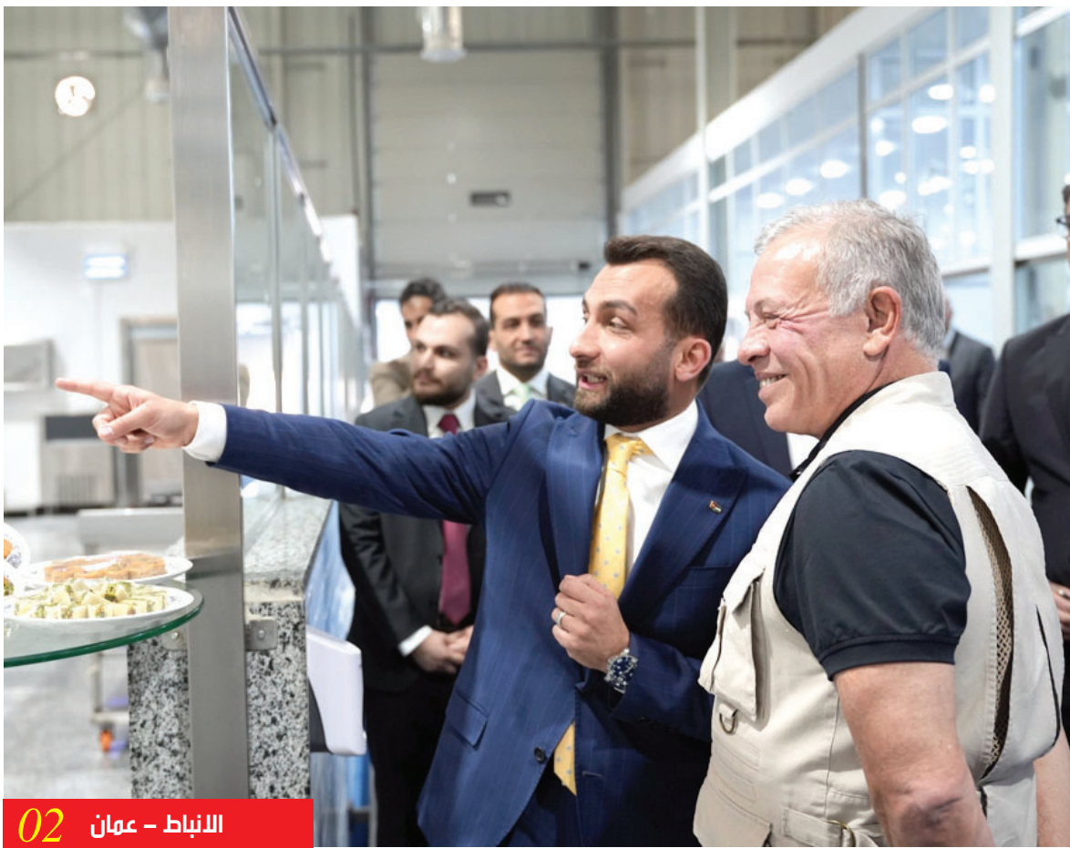
الانباط - عمان 02