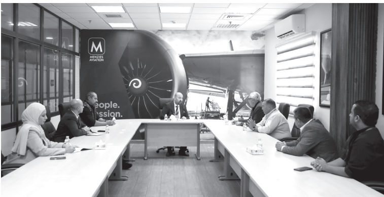
الانبساط - عمان