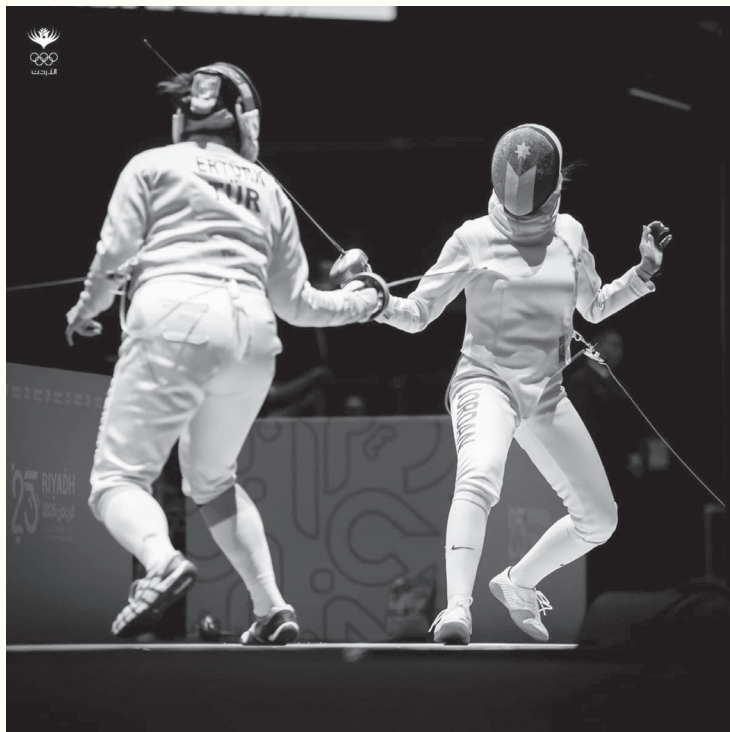
الأبطال - عمان

ووضعت قرعة النهائيات الآسيوية المنتخب في المجموعة الأولى إلى جانب السعودية (المستضيف) وفيتنام وقيرغيزستان، ويستهل المنتخب مشاركته في البطولة التي تقام خلال الفترة من ٦ - ٢٥ كانون الثاني المقبل، بمواجهة فيتنام ثم السعودية على أن يختم دور المجموعات بلقاء قيرغيزستان، وحسب نظام البطولة، تم تقسيم المنتخبات الـ ١٦ المشاركة في البطولة على ٤ مجموعات، بحيث تضم كل مجموعة ٤ فرق تتنافس بنظام الدوري الجزأ من مرحلة واحدة على أن يتأهل أول فريقين من كل مجموعة إلى الدور ربع النهائي.