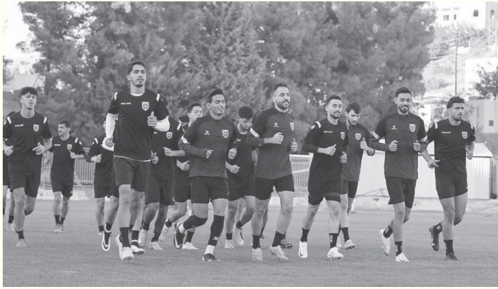
الأبطال - عمان

للمشاركة في النهائيات الآسيوية. ووضعت قرعة النهائيات الآسيوية المنتخب في المجموعة الأولى إلى جانب السعودية (المستضيف) وفيتنام وقرغيزستان. ويستهل المنتخب مشاركته في البطولة التي تقام خلال الفترة من ٦ - ٢٥ كانون الثاني المقبل، بمواجهة فيتنام ثم السعودية على أن يختتم دور المجموعات بقاء قرغيزستان. وحسب نظام البطولة، تم تقسيم المنتخبات الـ ١٦ المشاركة في البطولة على ٤ مجموعات، بحيث تضم كل مجموعة ٤ فرق تتنافس بنظام الدوري المجرى من مرحلة واحدة على أن يتأهل أول فريقين من كل مجموعة إلى الدور ربع النهائي.