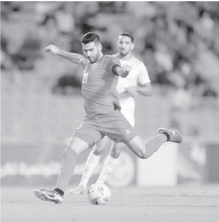
الأبطال - عمان

يلتقي المنتخب الوطني لكرة القدم، نظيره منتخب مالي، عند الساعة التاسعة من مساء اليوم الثلاثاء، في المباراة الودية التي تقام في تونس. ويقوم المنتخب الوطني معسكراً تدريبياً في تونس، تخلله مباراة ودية أمام منتخب تونس أقيمت الجمعة الماضي وانتهت بخسارة المنتخب