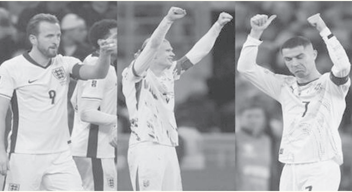
الأبطال - وكالات

١٨ هدفاً، ثانياً هاري كين (إنجلترا) ٨ أهداف إلى جانب ممفيس دييبي (هولندا) ٨ أهداف، ماركو أرناوتوفيتش (النمسا) ٨ أهداف، ثم أندريه كراماريتش (كرواتيا) ٦ أهداف، كيفن دي برون (بلجيكا) ٦ أهداف، ميكيل ميرينو (إسبانيا) ٦ أهداف، ماتيو ريتشي (إيطاليا) ٥ أهداف، ألكسندر سورلوث (النرويج) ٥ أهداف، إيدرين دجيكو (البوسنة) ٥ أهداف، كريستيانو رونالدو (البرتغال) ٥ أهداف، بارناباس فارغا (هنغاريا) ٥ أهداف، ميكيل أوبارزبال (إسبانيا) ٥ أهداف، تيلو أسغارد (النرويج) ٥ أهداف، تروي باروت (إيرلندا) ٥ أهداف، كيليان مبابي (فرنسا) ٥ أهداف.