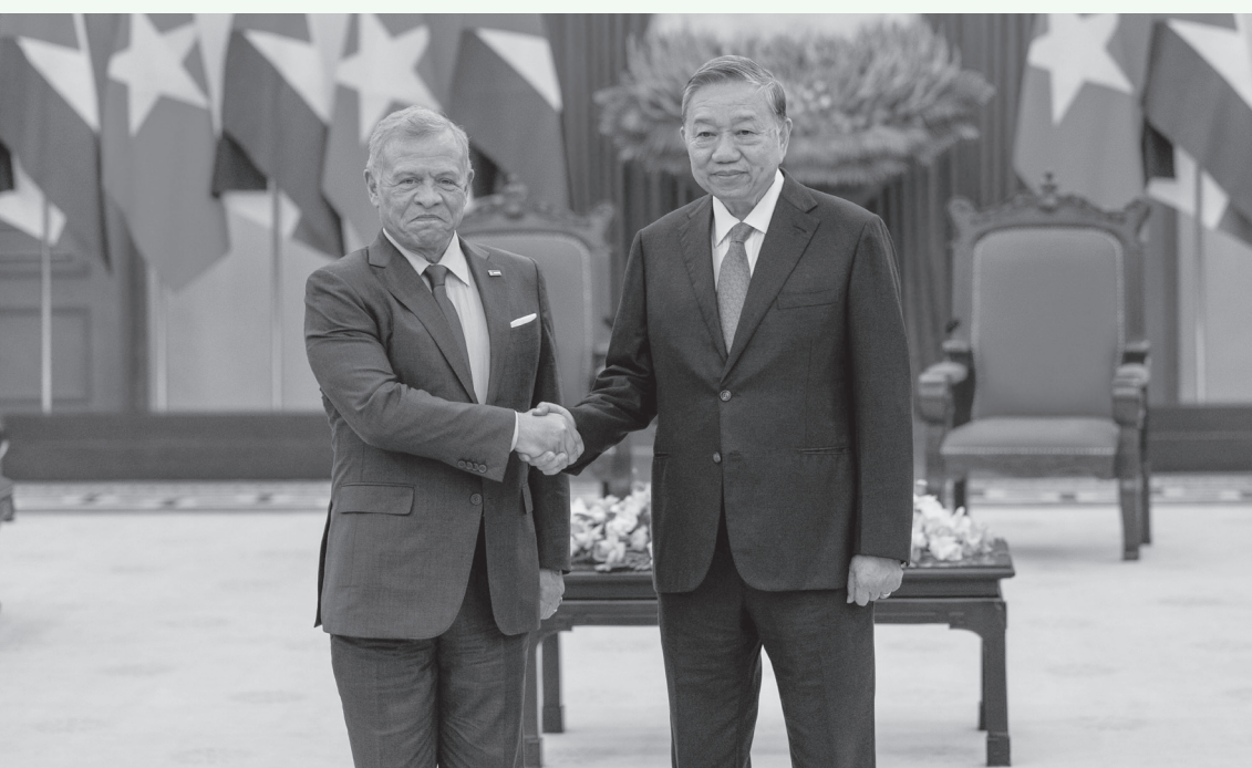
الأنباط - هانوي

تعزيز الأمن الغذائي. وحضر اللقاء نائب رئيس الوزراء ووزير الخارجية وشؤون المغتربين أيمن الصفدي، ومدير مكتب جلالة الملك، المهندس علاء البطاينة، ووزير الصناعة والتجارة والتموين المهندس يعرب القضاة، وسفير الأردن غير المقيم لدى فيتنام سائد الردايدة.