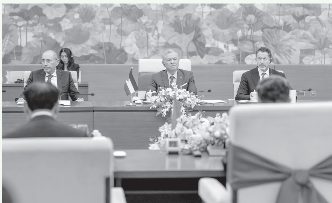
الأنباط - هانوي

وحضر اللقاء نائب رئيس الوزراء ووزير الخارجية وشؤون المغتربين أيمن الصفدي، ومدير مكتب جلالة الملك، المهندس علاء البطاينة، ووزير الصناعة والتجارة والتموين المهندس يعرب القضاة، وسفير الأردن غير المقيم لدى فيتنام سائد الردايدة.