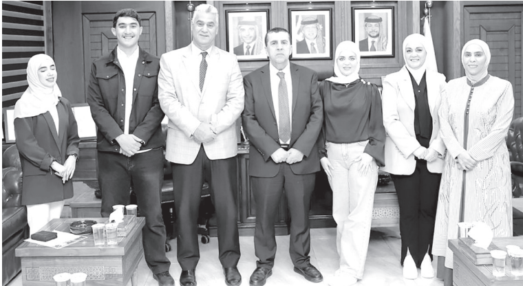
الأنباط – السلط

حققت جامعة البقاء التطبيقية مراكز متقدمة في الملتقى الطلابي الإبداعي الـ٢٦، الذي استضافته جامعة نزوى بسلطنة عمان أخيراً بعنوان: «الفرص والتحديات أمام المؤسسات التعليمية في ظل التطورات التكنولوجية».