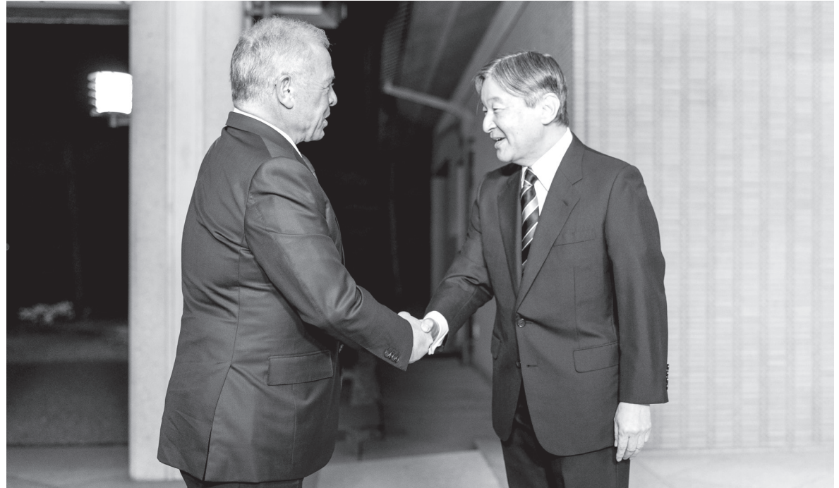
الأنباط - طوكيو

اليابانية. وتناول اللقاء، الذي حضره سمو الأمير غازي بن محمد، كبير مستشاري جلالة الملك للشؤون الدينية والثقافية، المبعوث الشخصي لجلالته، الشراكة الاستراتيجية بين الأردن واليابان وسبل توسيع التعاون، فضلاً عن بحث مجمل المستجدات في الشرق الأوسط.