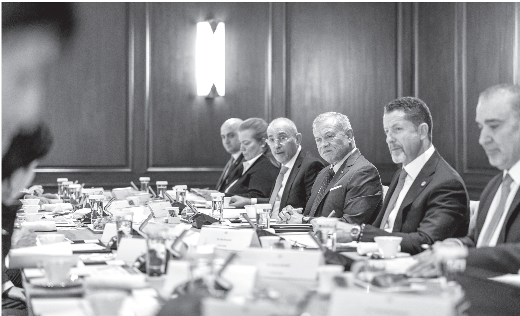
الأنباط - طوكيو

اجتمع جلالة الملك عبدالله الثاني، أمس الاثنين، بممثلين عن شركات يابانية وغرفة التجارة والصناعة اليابانية، لبحث تعزيز التعاون الاقتصادي والاستثماري بين الأردن واليابان.