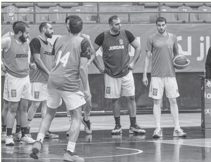
الأبطال - عمان

الإعلان عن اللاعب المجنس المزمع انضمامه إلى المنتخب خلال النافذة، وأوضح رانا في تصريح أن العمل جرى «بروح واحدة وعائلة ملتزمة بالبناء»، مؤكدا جاهزية اللاعبين لخوض الاستحقاق الآسيوي. ويستهل المنتخب مشواره في التصفيات بمواجهة المنتخب السوري عند الساعة ٧:٣٠ مساء يوم الخميس ٢٧ الشهر الحالي، قبل أن يلتقيه مجددا عند الساعة ٦:٠٠ مساء يوم الأحد ٣٠ من الشهر ذاته، في عمان. وأكد الاتحاد الأردني لكرة السلة ثقته بالجهازين الفني والإداري وبلاعبي المنتخب، مشددا على قدرتهم على تقديم أداء يعكس روح كرة السلة الأردنية، وداعيا الجماهير إلى المؤازرة ودعم «صقور الشامى» في مشوارهم نحو مونديال ٢٠٢٧.