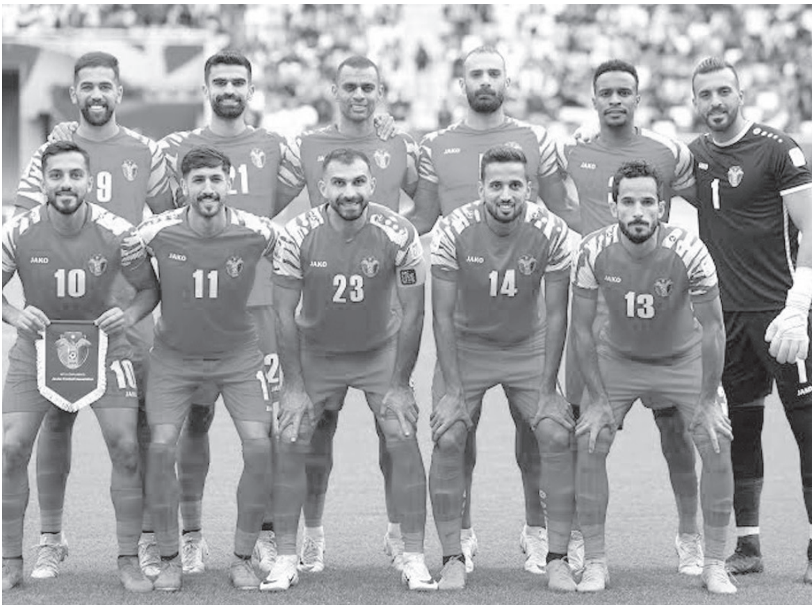
الأبطال - عمان

تونس الأربعاء المقبل، لإقامة معسكر تدريبي تتخلله مباراتان وديتان أمام منتخبي تونس ومالي، وذلك ضمن التحضيرات للمشاركة في كأس العرب التي تنطلق في قطر مطلع الشهر المقبل، وأيضا ضمن الاستعدادات لنهائيات كأس العالم التي تقام في الولايات المتحدة الأمريكية والمكسيك وكندا خلال حزيران المقبل. من جهته، باشر المنتخب الأولمبي تدريباته استعدادا لمباراة ودية أمام منتخب سوريا الخميس المقبل، في إطار التحضير لنهائيات آسيا التي تقام في السعودية خلال كانون الأول المقبل. ويوجد منتخب الشباب حاليا في تركيا في معسكر تدريبي بقيادة المدرب إسلام