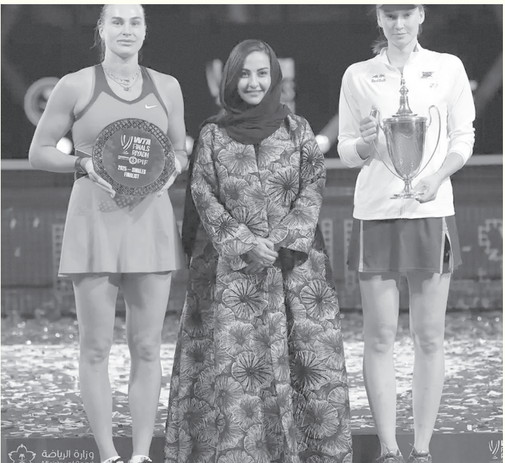
الأنباط - وكالات

للاعبة الكازاخستانية، البالغة من العمر ٢٦ عاماً، وهي سلسلة انتصارات بدأت بعد خسارتها أمام سابالينكا بالذات، في ووهان بالصين. أرقام قياسية حققت ريباكينا الآن سجلاً رائعاً يبلغ ٨ انتصارات مقابل ٦ هزائم، ضد اللاعبات المصنفات رقم ١ عالمياً. كما أصبحت أول لاعبة تهزم سابالينكا وإيجا شفيونتيك، في أكثر من حدين مختلفين تابعين لرابطة اللاعبات المحترفات، بعد أن حققت هذا الإنجاز سابقاً، في طريقها للفوز ببطولة إنديان ويلز عام ٢٠٢٣.