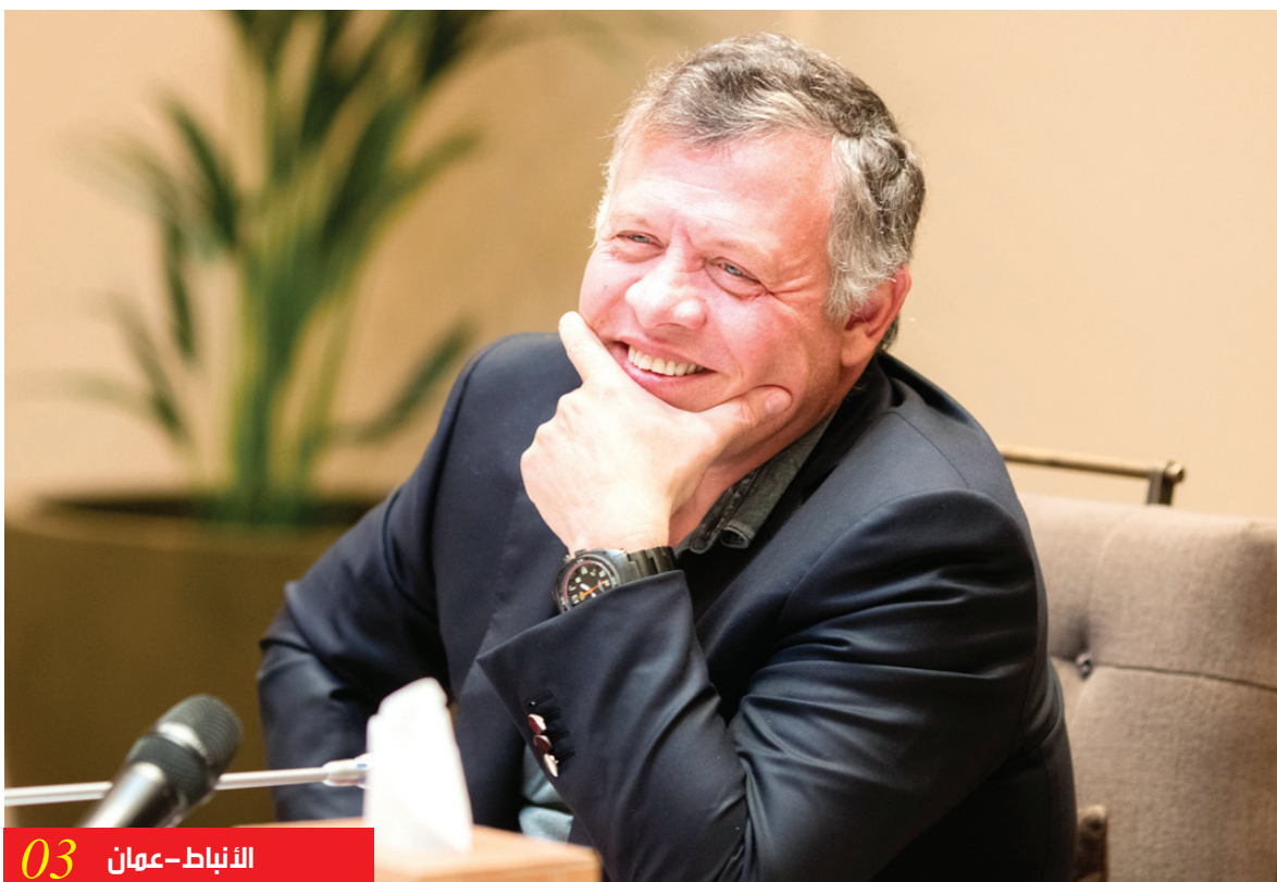
الأنباط - عمان 03

■ اتفاقيات تعاون ومذكرات تفاهم على هامش جولة الملك الأسبوية