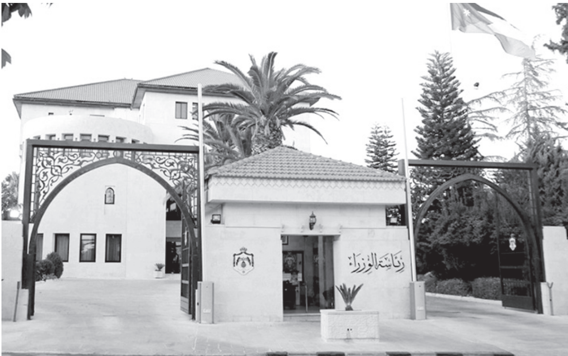
الأنباط - بترا