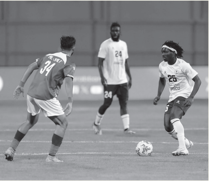
الأبواب - عمان