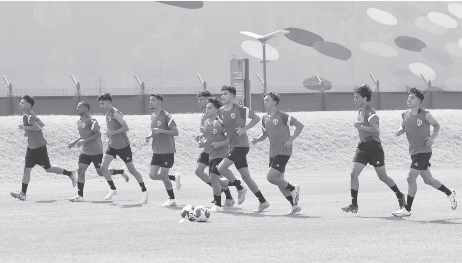
الأبواب - عمان

وتشهد البطولة مشاركة ٧ منتخبات تم توزيعها على مجموعتين ضمت الأولى: العراق، السعودية، لبنان، والكويت، بينما ضمت الثانية: الأردن، سوريا، وفلسطين. وحسب نظام البطولة، تم توزيع المنتخبات على مجموعتين، حيث يلعب