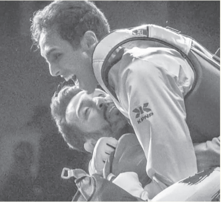
الأبواب - وكالات

سجل الرياضة المصري.، وكتب الاتحاد المصري للتايكوندو عبر حسابه على فيسبوك: «التاريخ يكتب بأيدي مصريي في الحدث الأكبر عالمياً. سيف عيسى يتربع على عرش التايكوندو العالمي بذهبية تاريخية في وزن أقل من ٨٧ كجم». وهذه الذهبية الأولى لعيسى في بطولة العالم بعدما توج بالبرونزية مرتين في بطولتي ٢٠٢٢ و ٢٠٢٣. يملك صاحب الـ ٢٧ عاماً سجلاً حافلاً بالميداليات والألقاب في مقدمتها الفوز ببرونزية دورة الألعاب الأولمبية «طوكيو ٢٠٢٠».