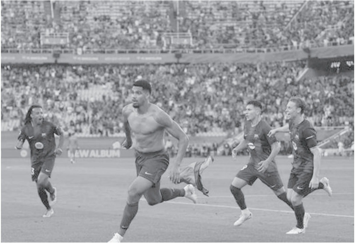
الأنباط _ عمان

بدأ برشلونة اللقاء بضغط قوي، حيث كان يبحث عن تسجيل الهدف الأول، وفي الدقيقة ١٣ أحرز الهدف الأول بمجهود فردي رائع من بيدري، بتسديدة من منطقة جزاء جيرونا. وفي الدقيقة ٢٠، تعادل جيرونا بضربة مزدوجة رائعة من أكسيل