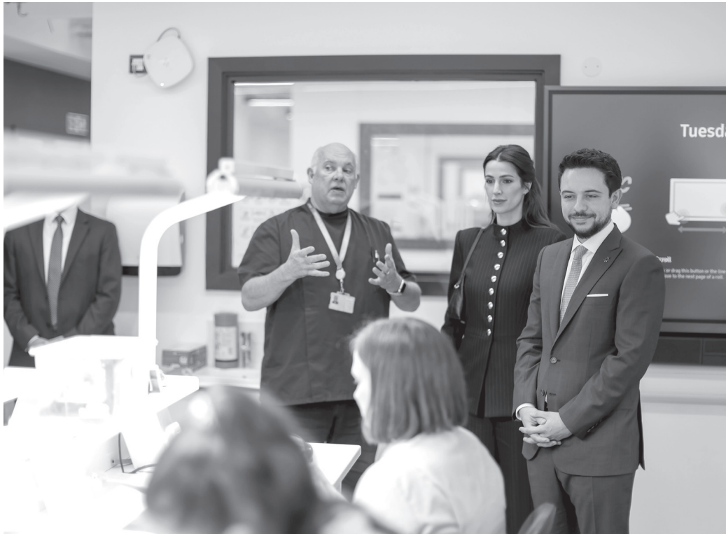
الأنباط – لندن

التقى سمو الأمير الحسين بن عبدالله الثاني، ولي العهد، في كلية «ساوث بانك» التقنية في لندن، أمس الثلاثاء، ممثلين عن شركة بيرسون العالمية، بحضور سمو الأميرة رجوة الحسين. وأشار سموه إلى أهمية الشراكة بين وزارة التربية والتعليم وشركة بيرسون، الشركة الرائدة عالمياً في مجال التعلم مدى الحياة، من خلال تنفيذ برنامج مجلس تعليم الأعمال والتكنولوجيا “BTEC” المعتمد من الشركة في المملكة. وأكد سمو ولي العهد أهمية التركيز على مخرجات هذا البرنامج التعليمي الذي يهدف إلى زيادة فرص الخريجين في الحصول على فرص عمل نوعية في المجالات التقنية والمهنية، وتأهيل المعلمين. وركز سموه، خلال اللقاء، على خطط المجلس الوطني لتكنولوجيا المستقبل، التي تهدف للاستفادة من التخصصات التي يتضمنها برنامج مجلس تعليم الأعمال والتكنولوجيا “BTEC” في تطوير العملية التعليمية. وجال سمو ولي العهد وسمو الأميرة رجوة في مرافق الكلية التقنية، واستمعا إلى شرح حول أساليب التدريس والتدريب التقني فيها. وحضر اللقاء السفير الأردني في لندن منار الدباس، ومدير مكتب سمو ولي العهد، الدكتور زيد البقاعين.