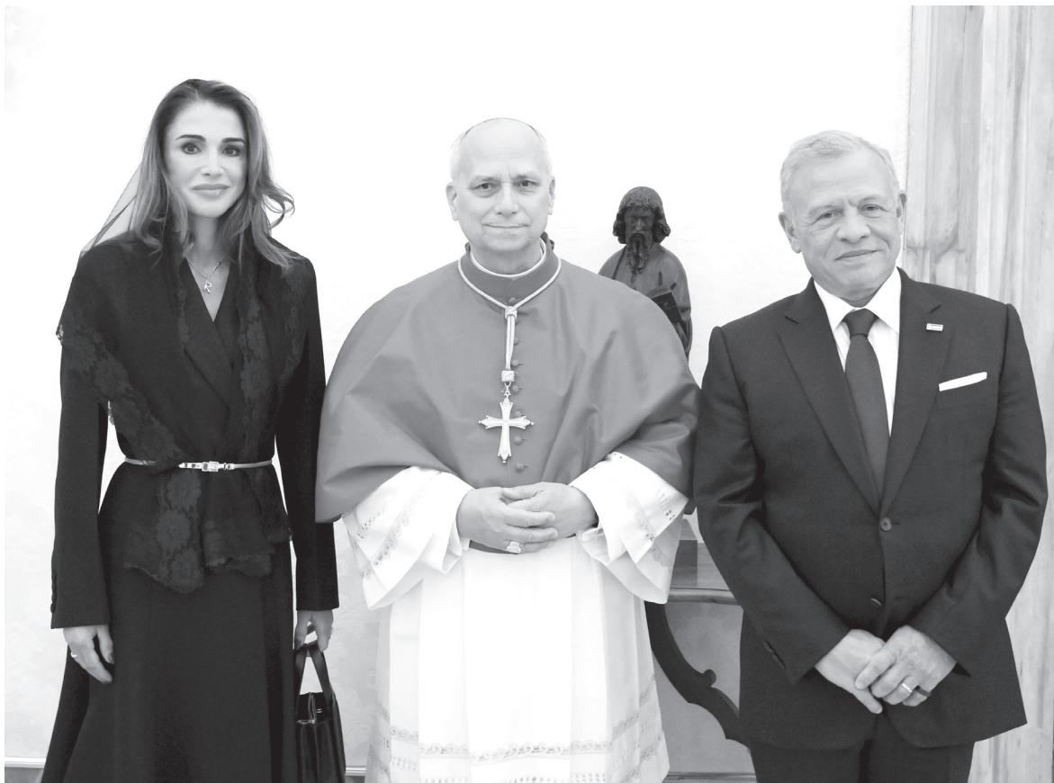
الأنباط – الفاتيكان

– أكد استمرار الأردن في رعاية المقدسات الإسلامية والمسيحية في القدس