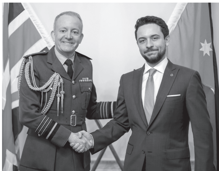
الأنباط – لندن

التقى سمو الأمير الحسين بن عبدالله الثاني، ولي العهد، في لندن، أمس الثلاثاء، رئيس أركان الدفاع البريطاني الفريق أول جوي السير ريتشارد نايتون. وأكد سمو ولي العهد أهمية تعزيز الشراكة بين الأردن والمملكة المتحدة في المجالات كافة، خصوصاً الدفاعية منها. وتطرق اللقاء إلى المستجدات الإقليمية، لا سيما في غزة والضفة الغربية وسوريا ولبنان، وسبل استعادة الاستقرار في المنطقة. وحضر اللقاء السفير الأردني في لندن منار الدباس، ومدير مكتب سمو ولي العهد، الدكتور زيد البقاعين.