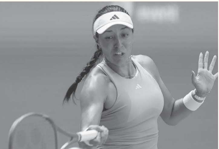
الأنباط - وكالات

وتواجه بيجولا في الدور المقبل المصنفة التاسعة إيكاترينا ألكساندروفنا، التي تغلبت على أمريكية أخرى، أن لي. في الدور الثاني بمجموعتين دون رد بواقع (٦-٧) و(٦-٦).