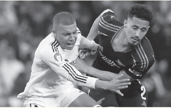
الأنباط - وكالات

بالنسبة لي. أردت أن أوصل مشواري مع أرسنال لأنني أشعر أنني في بيتي هناك. النادي يمتلك مشروعاً رائعاً ومديراً مميزاً، وأنا مقتنع بأن البطولات قادمة قريباً.