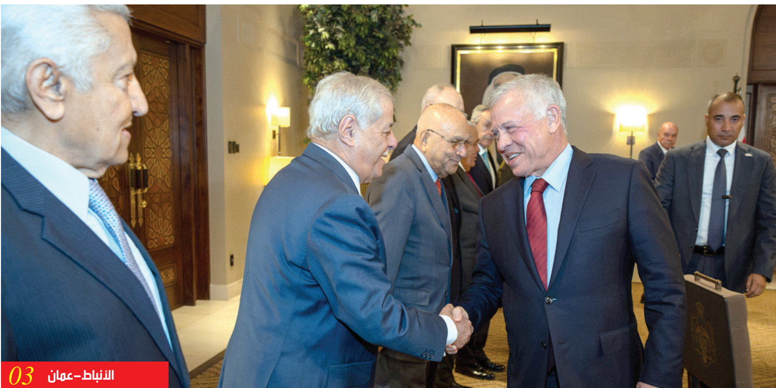
الأنباط - عمان 03

المياه.. هل يضل منتدى الاستراتيجيات صانع القرار والمواطن؟ كارثة بحثية تحرك المياه الراكدة.. خبراء ورقة «الاستراتيجيات» تتجاهل الأحواض والآبار والإطار القانوني