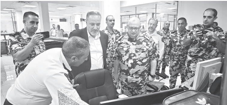
الأنياب – عمان

على هامش اجتماع مجلس الوزراء في محافظة العقبة ويتوجهات من دولة رئيس الوزراء أجرى معالي وزير المالية الدكتور عبدالحكيم الشبلي زيارة تفقدية إلى مركز جهرم العقبة ، اطلع خلالها على سير العمل في وحدات التخليص وساحات المعاينة، في إطار المتابعة الميدانية المستمرة لتطوير بيئة العمل الجمركي وتحسين جودة الخدمات المقدمة. وأكد الشبلي، خلال الجولة، على أهمية تسهيل الإجراءات وتسريع عمليات التخليص الجمركي، لما لذلك من دور محوري في تقليل زمن الإفراج عن البضائع، وبالتالي خفض التكاليف على المستوردين والمصدرين، ودعم حركة التجارة وتعزيز التنافسية الاقتصادية. وشدد الشبلي على ضرورة تعزيز روح الشراكة والمسؤولية بين كافة أطراف العملية الجمركية، بما يضمن التكامل والتنسيق الفاعل لتحقيق أعلى درجات الكفاءة والشفافية. وفي سياق متصل، اطمأن معالي الوزير على الملاحظات الواردة من عدد من السادة النواب بشأن المخاوف التي أبدىها بعض سائقي الشحن حول أجهزة الفحص بالأشعة (X-Ray) المستخدمة لفحص الحمولات مؤكداً معاليه أن جميع أجهزة الفحص العاملة في العقبة وجميع المراكز الجمركية تخضع لأعلى معايير السلامة الدولية، ولا تشكل أي خطر على صحة السائقين أو الكوادر الجمركية حيث ان الأجهزة مرخصة من قبل هيئة تنظيم قطاع الطاقة والمعادن، وتعمل ضمن نظام رقابة إشعاعية متقدم تضمن مراقبة دقيقة لمستويات التعرض، وتحقق أعلى مستويات السلامة.