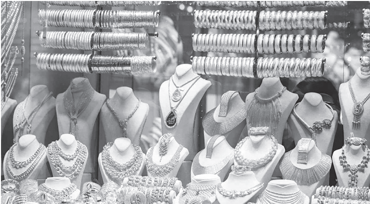
الأنياب – عمان

بلغ سعر بيع غرام الذهب عيار ٢١ الأكثر رغبة من المواطنين في السوق المحلية أمس السبت، عند ٧٦,٣٠ دينار لغايات البيع من محلات الصاغة، مقابل ٧٣,٨٠ دينار لجهة الشراء. وبلغ سعر بيع الغرام الواحد من الذهب عيارات ٢٤ و ١٨ و ١٤ لغايات الشراء من محلات الصاغة، عند ٨٧,٣٠ و ٦٧,٥٠ و ٥١,٥٠ دينار على التوالي.