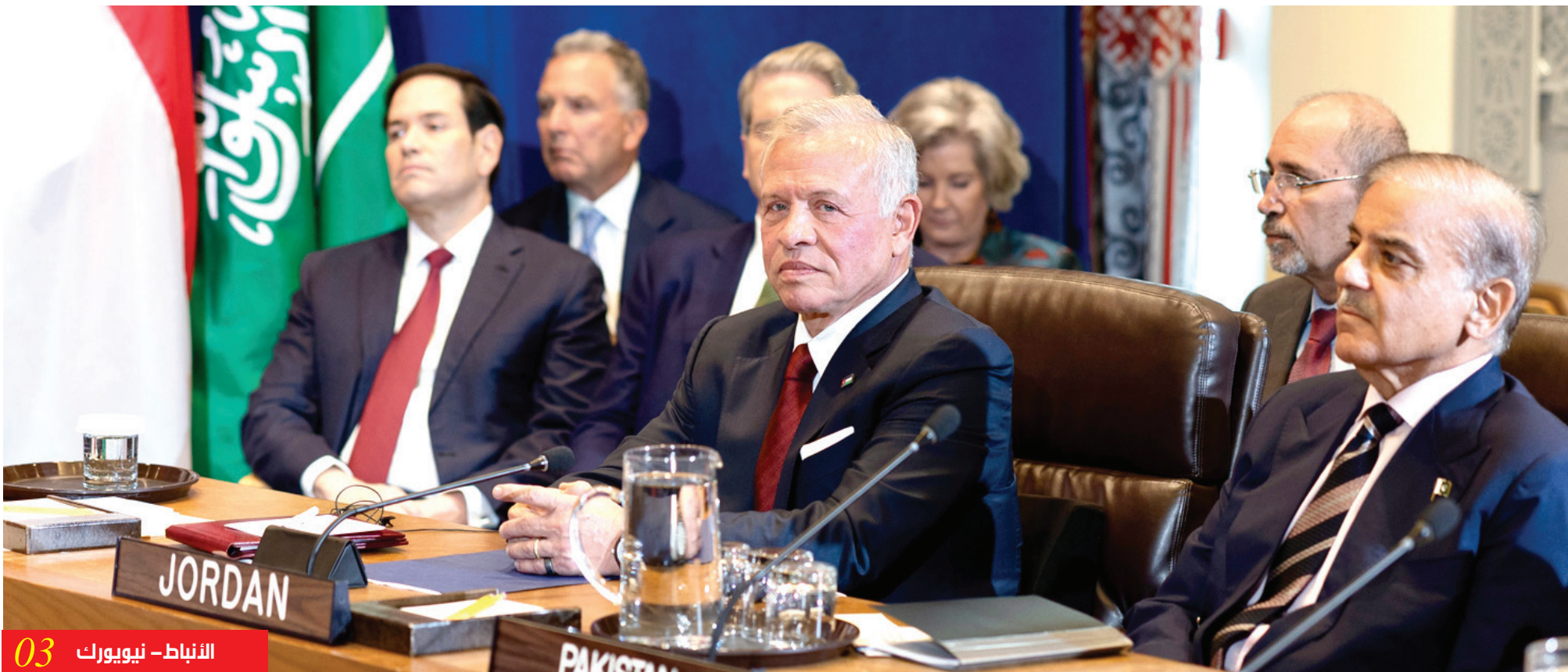
الأنباط - نيويورك 03

أهمية العمل مع الولايات المتحدة على خطة شاملة لغزة تنتهي الحرب والمعاناة الملك: بينما نعمل لحل الصراع في غزة، لا نريد أن نرى صراعا آخر يندلع في الضفة الغربية