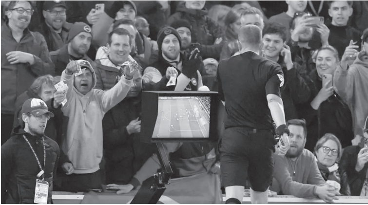
الأنباط – وكالات

كشفت تقارير صحفية استعداد الاتحاد الدولي لكرة القدم «فيفا» لإجراء تعديل استثنائي على تقنية الفيديو، سيتم تطبيقه لأول مرة خلال كأس العالم للشباب تحت ٢٠ عاماً، المقرر إقامتها في تشيلي بحلول نهاية الشهر الجاري. بحسب ما أوردته شبكة TyC الأرجنتينية، فإن التعديل سيتمخ مدرب كل فريق حق طلب مراجعة الفيديو مرتين فقط طوال المباراة، في خطوة تسعى لتقليل التوقفات والحفاظ على إيقاع اللعب.