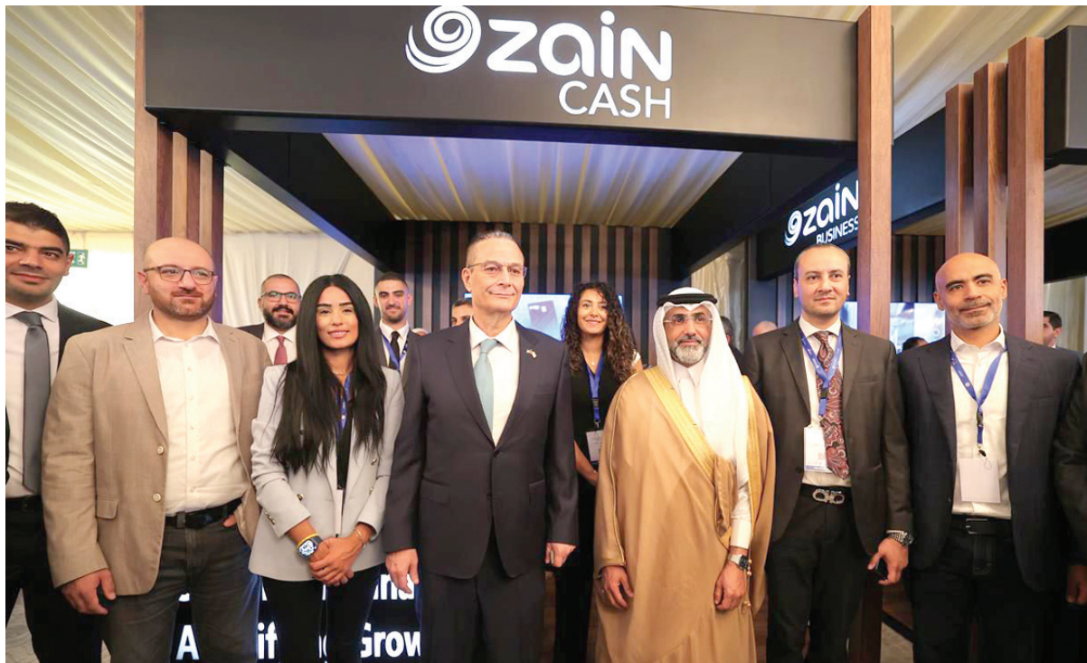
الأنباط - عمّان