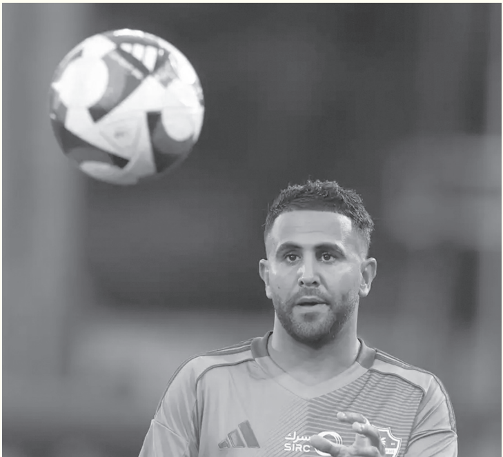
الأنباط – وكالات

للتواصل الاجتماعي فيديو لرياض محرز أثناء الخروج أمام وسائل الإعلام، حيث طالبه البعض بالوقوف والتحدث إليهم، ولكنه رفض بشكل قاطع. وقال محرز للجميع، أثناء مغادرة المنطقة الخاصة بوسائل الإعلام: «والله أنا ميت»، معبراً عن حالة الإرهاق التي تحدث عنها ياسله والمتحدث الرسمي. يذكر أن محرز فشل في تقديم أي شيء يذكر أمام الفريق المصري، حيث عانى من رقابة لصيقة طوال ٩٠ دقيقة.