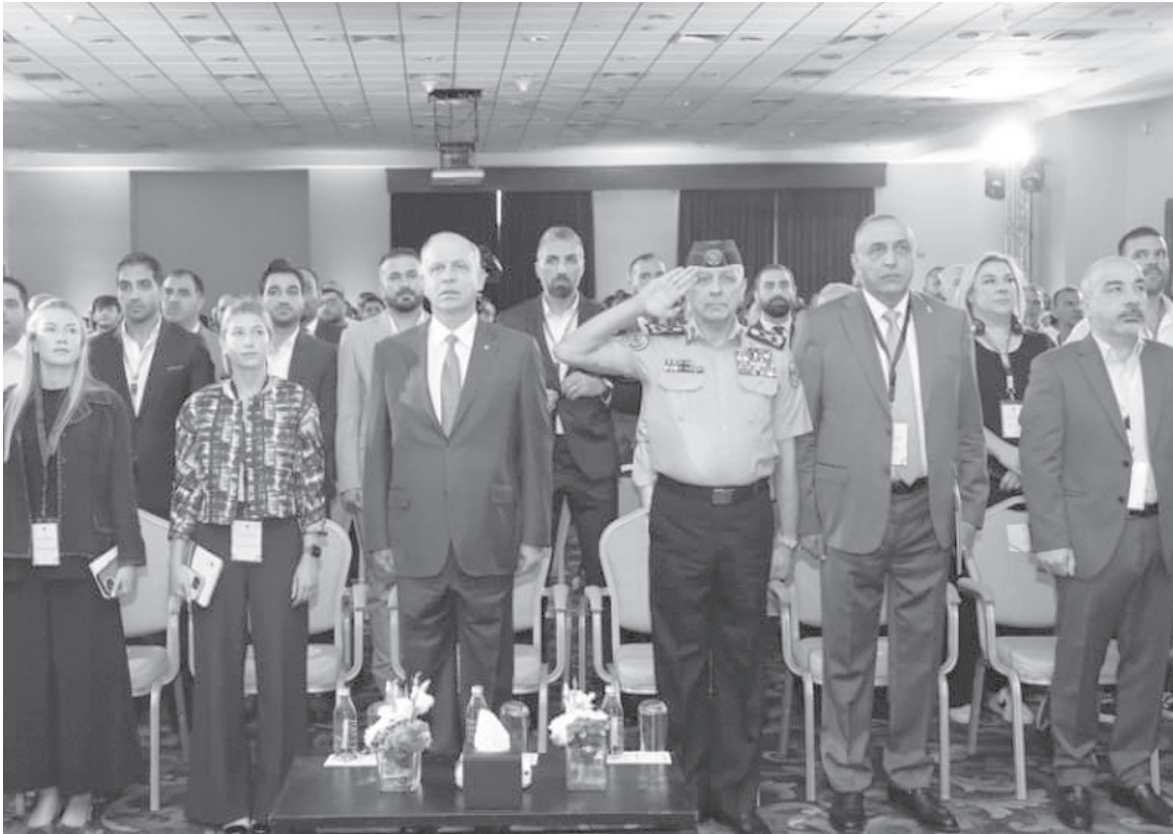
الأنباط – عمان

وفي ختام أعمال المؤتمر، كرم سمو الأمير فيصل الاتحاديين الأردني لكرة القدم والعب القوى، تقديراً لجهودهما كنماذج ناجحة في تطبيق معايير الأمان الرياضي.