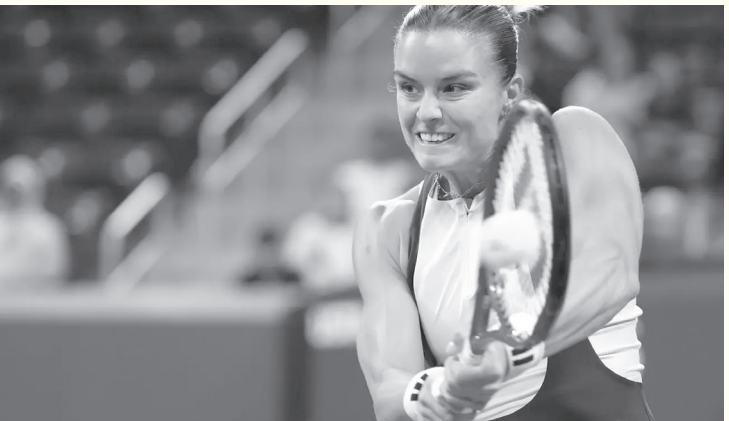
الأنباط – وكالات

وأطاحت الروسية كاميليا راكيموفا بالإيطالية لوسيا برونزيتي، بعد التغلب عليها بنتيجة (٦-٤) و(٦-١)، لتصعد في الدور الثاني بالأمريكية كوكو جوف. وحجزت الأمريكية مكارنتي كيسلر مقعدها في الدور الثاني، بعد التغلب على الصينية شاي هان بنتيجة (٢-٦) و(٧-٦)، لتواجه البلجيكية إليز ميرتنز. ولحققت الرومانية سورانا كريستيا بركب المتأهلات للدور الثاني، بالتغلب على الأمريكية كارولين دوليدي بنتيجة (٦-٢) و(٦-٣)، لتلتقي بالإيطالية جاسمين باوليني في الدور الثاني.