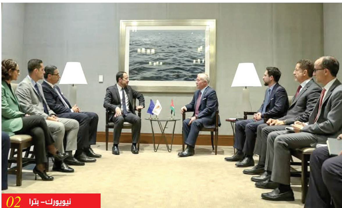
نيويورك - بتر 02

◀ يجب أن تنتهي الحرب وان تتدفق المساعدات على غزة