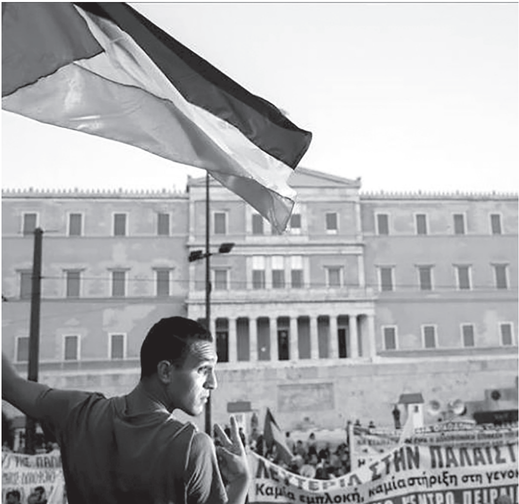
الأنباط - وكالات

احتج نشطاء مؤيدون لفلسطين في العاصمة اليونانية أثينا على أحد الفنادق المملوكة لمستثمرين إسرائيليين من خلال سكب طلاء أحمر عليه.