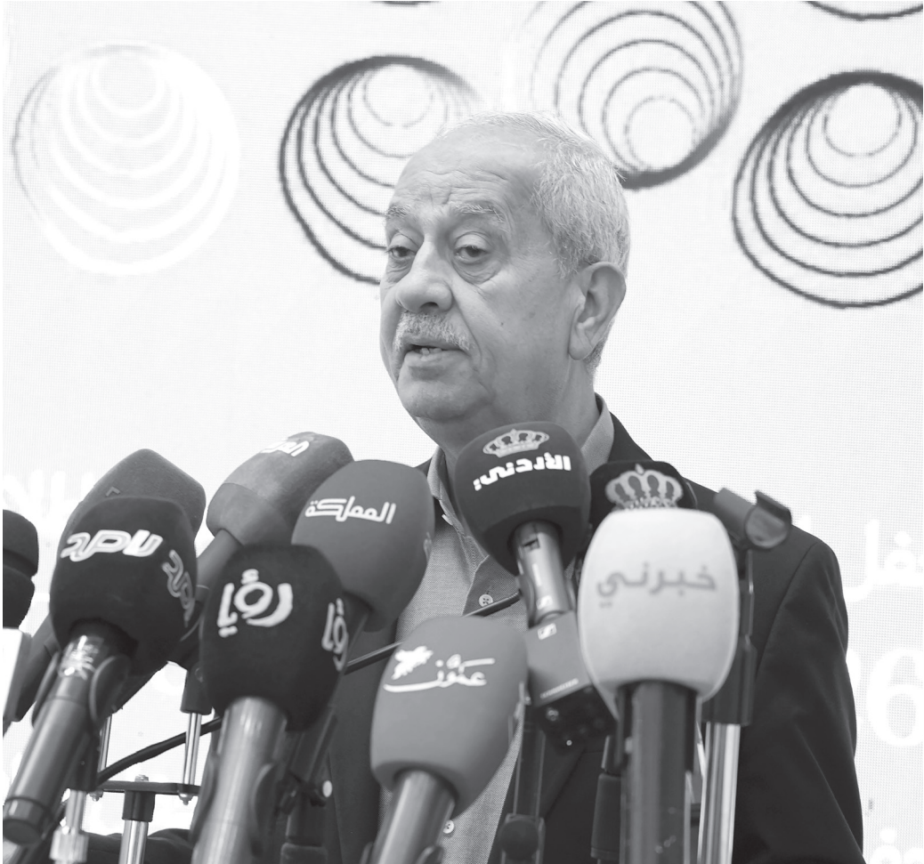
الأنباط - عمان

ينطلق في العاشر من آيار القادم المؤتمر والمعرض الدولي الاردني للمنظفات في دورته الخامسة بتنظيم من غرفة صناعة عمان، بمشاركة أكثر من ٥٠٠ شخصية من القطاع الصناعي والعلمي والباحثين، بينهم ٢٤ محاضرا، فيما يشارك في المعرض ١٠٠ شركة عارضة من ٤٠ دولة.