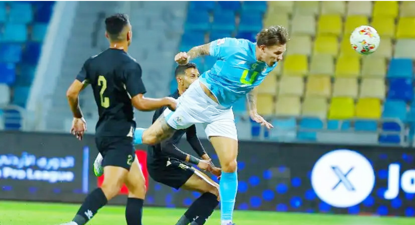
ضد الحسين إريد.