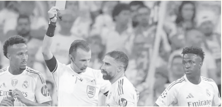
الأبطال - وكالات

للإيقاف حتى ٣ مباريات وفق المادة ١٥ من لائحة الانضباط باليويفا، والمتعلقة بـ «السلوك غير الرياضي للاعبين أو المدربين». في أفضل السيناريوهات، قد تُصنّف الواقعة على أنها سلوك غير رياضي وليست اعتداءً، لتقتصر العقوبة على مباراتين فقط، وفقا للبند (د) من المادة المذكورة، الذي ينص على «إيقاف مباريات أو لمدة محددة بسبب السلوك غير الرياضي الجسيم». وبحسب الصور التلفزيونية، يبدو أن كارفاخال معرض لعقوبة أشد لا تقل عن ٣ مباريات وربما أكثر، بموجب البند (هـ) من نفس المادة، الذي ينص على «إيقاف ثلاث مباريات أو لمدة محددة عند الاعتداء على لاعب آخر أو أي شخص موجود في المباراة».