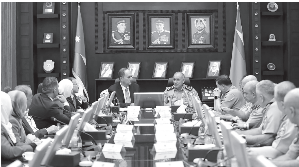
الانباط - عمان

أكد وزير العدل الدكتور بسام التلهوني، أن التعاون القائم بين وزارة العدل ومديرية الأمن العام يمثل ركيزة أساسية لتعزيز سيادة القانون ووصون الحقوق والحريات، باعتباره شراكة وطنية تخدم العدالة وتحمي المجتمع. وقال التلهوني، في تصريح صحفي أمس الأربعاء، إن زيارته إلى مديرية الأمن العام ولقاءه مدير الأمن العام اللواء الدكتور عبيد الله المعايطة، شكلا خطوة مهمة على طريق ترسيخ التنسيق المشترك، بما يسهل على المواطن الوصول إلى العدالة ويعزز الثقة بمؤسسات الدولة. وبين أن اللقاء تناول آليات تطوير التعاون في مجالات التنفيذ القضائي وإدارة مراكز الإصلاح والتأهيل، لافتا إلى أن هذه الجهود تسهم في تحسين الخدمات المقدمة للمواطنين وتخفيف الأعباء عنهم من خلال إجراءات تقاض أكثر بسرا وعدالة. وأشاد بالجهود التي تبذلها مديرية الأمن في مكافحة الجريمة وحماية المجتمع، مؤكدا أن هذه الجهود تعكس التزام المديرية برسالتها في صون أمن الوطن وحقوق الإنسان على حد سواء. وأشار التلهوني، إلى أن الوزارة ماضية في تعزيز العمل المشترك عبر توظيف أحدث الوسائل التكنولوجية، ومنها خدمات المحاكمة من بعد والربط الإلكتروني، بما يختصر الوقت والجهد، ويجعل العدالة في متناول الجميع بعدالة