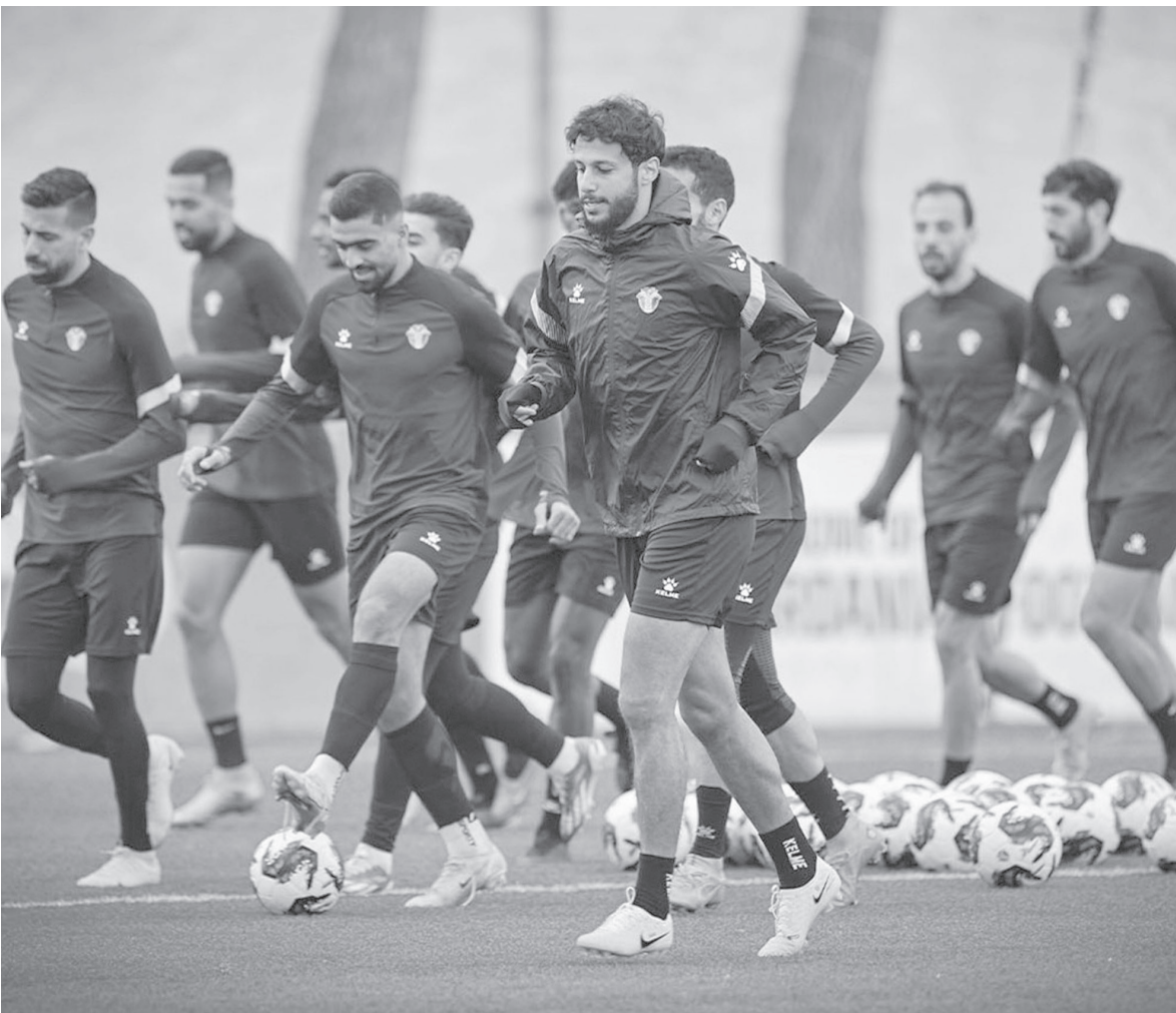
الأبطال - عمان

فخر لكل العرب، حيث يزيد من عدد المنتخبات العربية المتواجدة في المونديال، كما يساهم في الترويج لكرة الأردنية أقوى وأكبر مهرجان في كرة القدم العالمية.