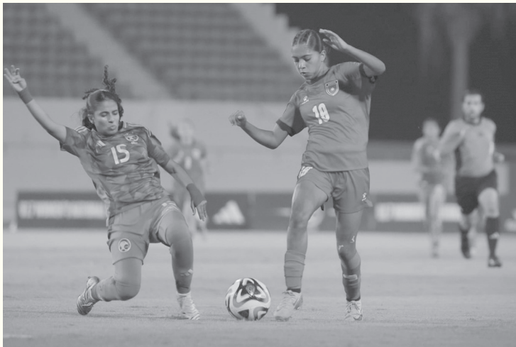
الأبطال - عمان

تحضيرات المنتخب لخوض التصفيات الآسيوية ضمن المجموعة الثامنة التي يستضيفها الاتحاد الأردني لكرة القدم خلال الفترة من ١٣ حتى ١٧ تشرين الأول المقبل في العقبة. وحسب نظام البطولة، تم تقسيم المنتخبات المشاركة في التصفيات إلى ثمان مجموعات، حيث تضم خمسة مجموعات ثلاثة منتخبات وثلاثة أخرى تضم كل منها أربعة منتخبات على أن يتأهل أبطال المجموعات الـ ٨ إلى البطولة القارية.