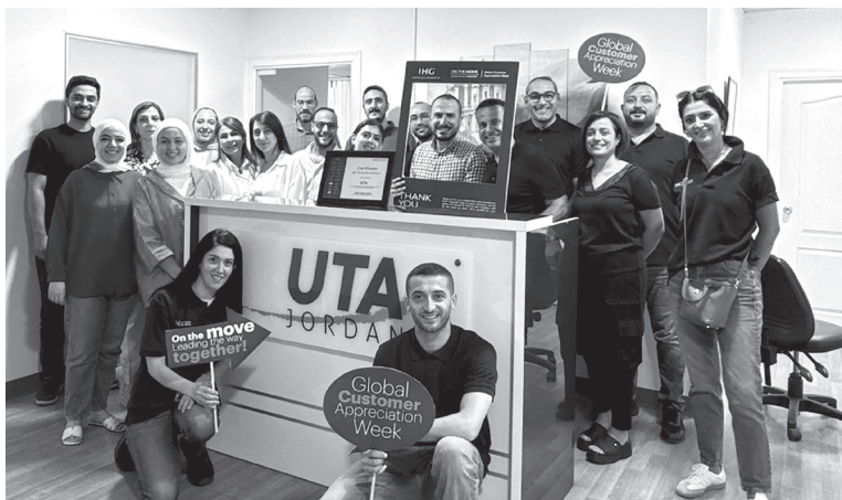
الانباط - عمان

شاركت فنادق ومنتجعات إنتركونتيننتال في الأردن بالاحتفال العالمي السنوي لأسبوع تقدير العملاء، الذي عكس التزام كبير بتقدير الشركاء الرئيسيين للمجموعة، والذين يساهمون بشكل رئيسي في النجاح المستمر. وشملت فعاليات الأسبوع زيارات عديدة قام بها فريق عمل فنادق ومنتجعات إنتركونتيننتال في الأردن، والتي تضم فنادق إنتركونتيننتال وكراون بلازا وهوليديا. إن وأكدت المجموعة خلال الفعالية امتنانها لثقة الشركاء المستمرة وتعاونهم على مدار السنوات، مجددة التزامها بتطوير هذه العلاقات واستكشاف آفاق جديدة للنمو والنجاح المشترك في المستقبل. وأوضحت المجموعة أن أسبوع التقدير للعملاء يتجاوز كونه مناسبة للاحتفال، ليؤكد أن الشركاء هم محور جميع الجهود، وأن التعاون القائم على الثقة والتميز يشكل الركيزة الأساسية لنجاح الأعمال واستدامتها. وتعكس هذه المبادرة القيم الجوهرية لفنادق ومنتجعات إنتركونتيننتال المتمثلة في العناية والالتزام والثقة، والتي تهدف إلى ضمان شعور جميع الشركاء بالتقدير والاعتراف بمساهماتهم. وتواصل فنادق ومنتجعات إنتركونتيننتال في الأردن العمل على تقديم خدمات رفيعة المستوى وتجارب استثنائية، إلى جانب بناء شراكات قوية ومستدامة.