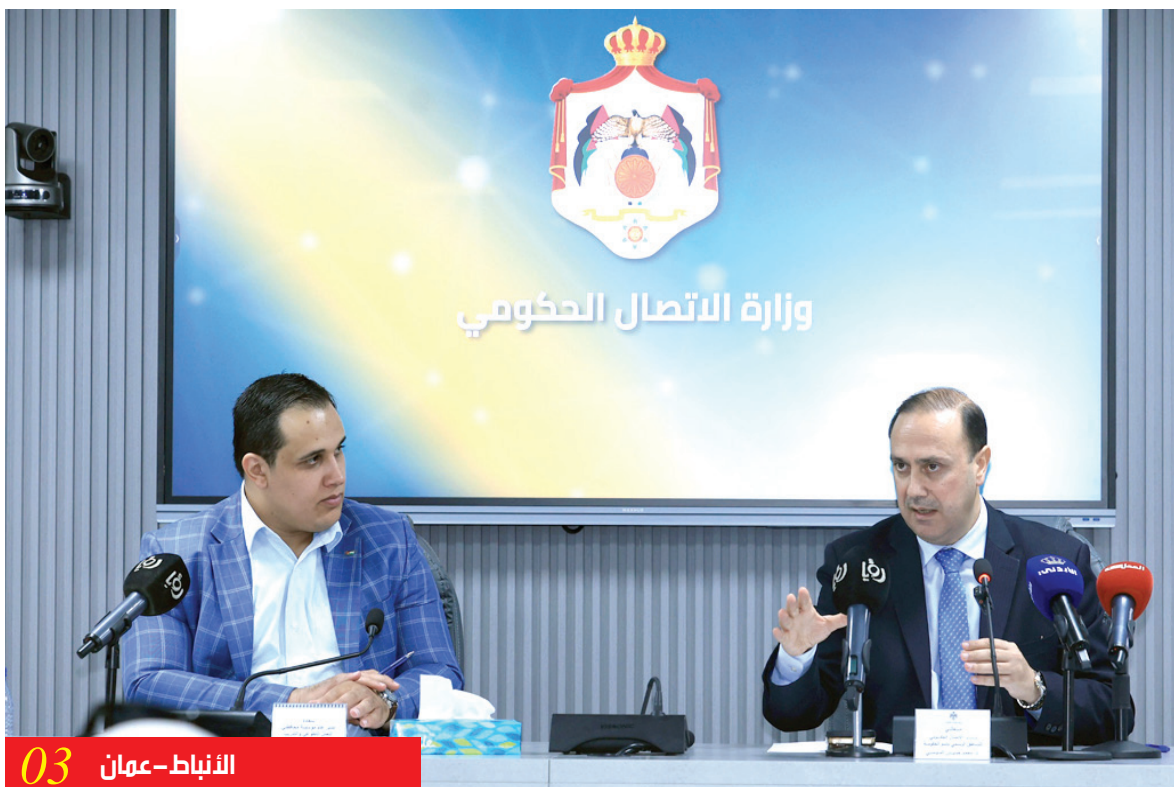
الانباط - عمان 03

قال وزير الاتصال الحكومي الناطق الرسمي باسم الحكومة الدكتور محمد المومني، إن الحكومة ستعمل على إدارة حوار وطني ونقاشات حول قوانين الإدارة المحلية، بالإضافة الى جلسات مناقشة مسار التحديث الإداري بأبعاده كافة.