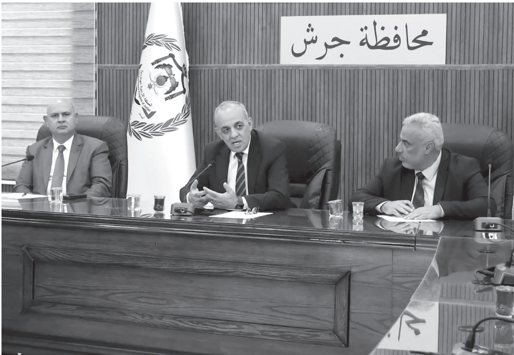
الأنباط - جرش

قال وزير السياحة والآثار الدكتور عماد حجازين، إن لجنة ستشكل للاطلاع على الخطط والمشاريع في محافظة جرش التي لها أثر مباشر في النهوض بالقطاع السياحي. وأكد حجازين خلال لقاء عقد بمبنى محافظة جرش أمس الأحد، أن الوزارة تولي اهتماماً خاصاً بالسياحة في المحافظة، مشيراً إلى أهمية تعاون مختلف الجهات المعنية لوضع حلول للتحديات التي تواجه ربط المدينة الحضرية بالمدينة الأثرية في جرش.