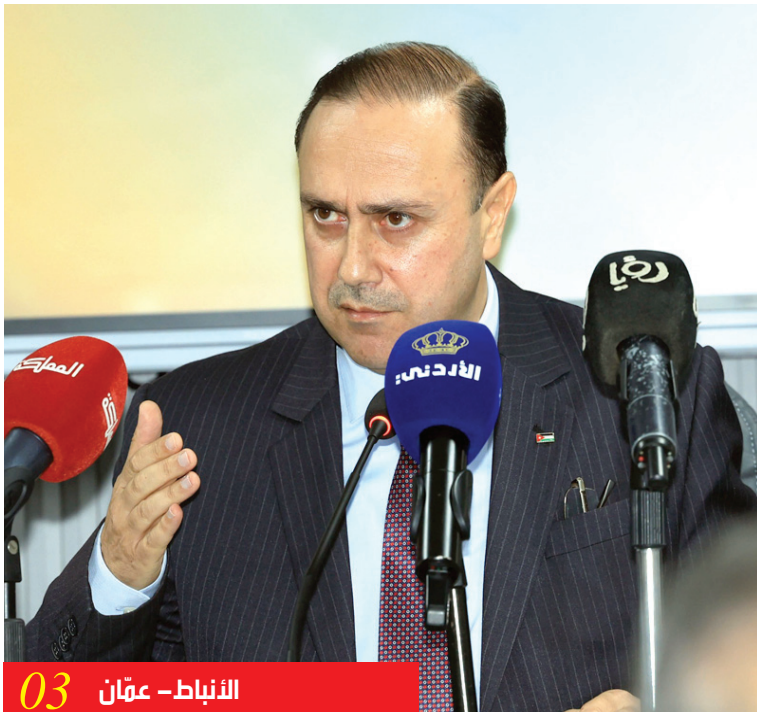
الأنباط - عمان 03

في ظل التحولات المتسارعة التي يشهدها قطاع التعليم في الأردن، يتزايد الاهتمام بالتعليم المهني باعتباره أحد المحاور الرئيسة لتحقيق التنمية المستدامة وتزويد الطلبة بالمهارات الفنية والتطبيقية التي تؤهلهم للانخراط في سوق العمل.