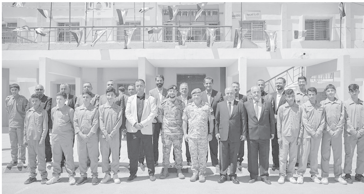
الانباط - الزرقاء

جلالتة يوجه إلى دراسة احتياجات المدرسة والعمل على تطوير مشاغلها وغرفها الصفية