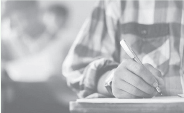
الأنباط - شذى حاتملا

نظام التقييم الحالي لا يعكس أداء الطلبة بعدالة