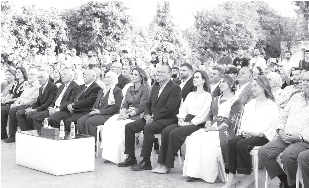
خدمة المجتمع. وحضر افتتاح البازار جمع حاشد من أبناء المجتمع

وأعربت إدارة النادي الاهلي عن بالغ اعتزازها برعاية جلالة الملكة رانيا العبدالله وافتتاحها لهذا الحدث، مؤكدة أن هذه الرعاية تشكل حافزاً لمواصلة العمل على تنظيم فعاليات نوعية تعكس مكانة النادي التاريخيه ودوره في