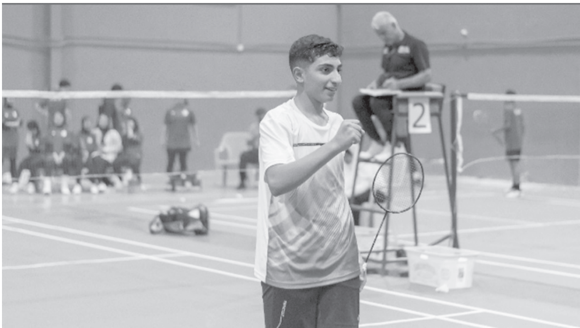
عمان- اتحاد الاعلام الرياضي

أسفرت نتائج مباراتي الجولة الثانية لفرق الريشة الطائرة عن فئة الطلاب عن فوز السعودية على مصر بنتيجة ٣-٠، فيما جاءت نتيجة المباراة الثانية بفوز الأردن على لبنان ٢-١، بينما انتهت مباراتي فرق الطالبات لذات اللعبة بفوز الأردن على مصر ٢-١، فيما تلغبت لبنان على السعودية بذات النتيجة، وأقيمت المباريات على صالة مؤقتة ضمن البطولة العربية للرياضة المدرسية.