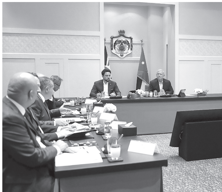
وحضر اللقاء مدير مكتب جلالة الملك، المهندس علاء البطاينة، ووزير دولة للشؤون الاقتصادية مهند شحادة، ووزيرة التخطيط والتعاون الدولي زينة طوقان، ووزير الاستثمار الدكتور طارق أبو غزالة.