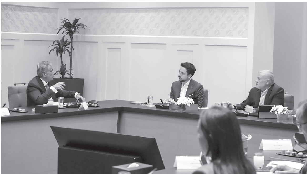
مع المواطنين لتوضيح مبادرات رؤية التحديث الاقتصادي وخطط العمل الحكومي. مشيراً إلى أهمية التركيز في المرحلة المقبلة على تحسين جودة الخدمات. كما أكد جلالته أهمية إدامة التواصل هذه الورشات، وما تتضمنه من مبادرات وأولويات تخدم البرنامج التنفيذي الحكومي القادم لتعزيز نهج المشاركة،