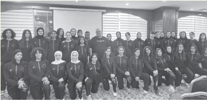
الأبطال - وكالات