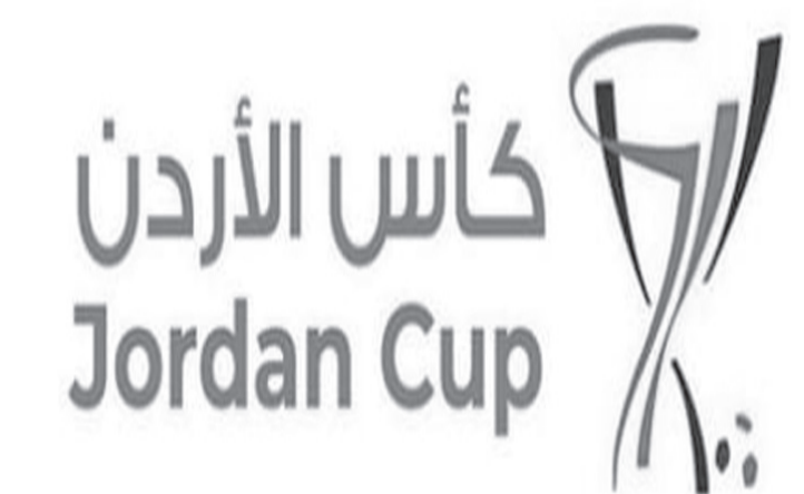
الأبطال - عمان

بمشاركة أندية المحترفين، والدرجة الأولى، والفرق المتبقية من دوري الدرجة الثانية.