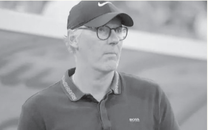
الأبطال - وكالات

وبحسب موقع «سوها سكور»، لإحصائيات كرة القدم، فإن نسبة استحواذ الاتحاد على الكرة وصلت إلى ٦٣٪ مقابل ٣٧٪ للفريق النصري، بالإضافة لقيام «العميد» ب٢٤٧ تمريرة مقابل ١٤٦ للخصم.