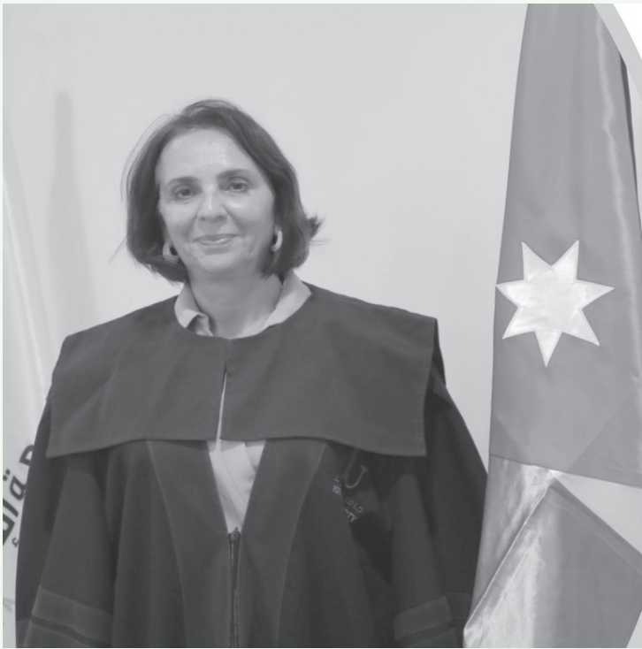
الأنباط – ميناى بنى ياسين

مواجهة سيناريوهات بيئية وصحية واجتماعية قاسية.