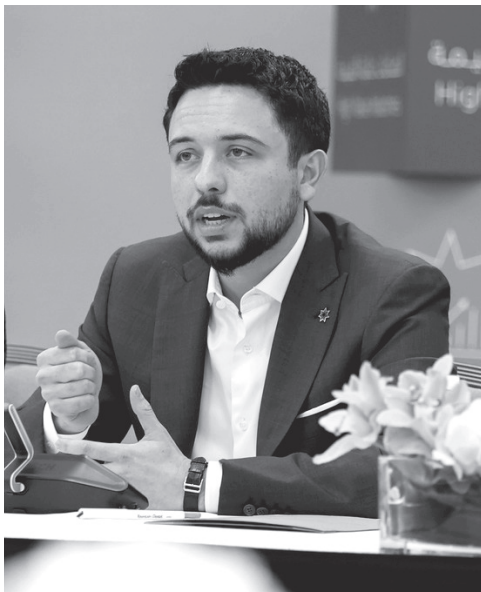
الأنباط – عمان

وأكد سموه، في مداخلة أثناء الجلسة، أهمية قطاع الاتصالات وتكنولوجيا المعلومات وتوظيف أدواته في الارتقاء بمستوى الخدمات المقدمة للمواطنين، والتسهيل عليهم. وأشار سمو ولي العهد إلى ضرورة تضافر جهود القطاعين العام والخاص في تطوير هذا المجال، لتعزيز النمو الاقتصادي وتوفير فرص عمل للشباب.