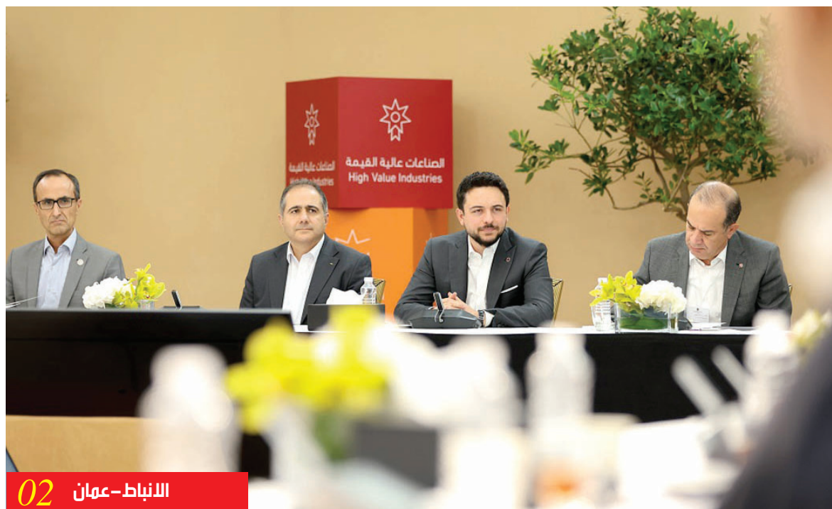
الانباط - عمان 02

حضر سمو الأمير الحسين بن عبدالله الثاني ولي العهد، أمس الاثنين، جانيا من الجلسة الحوارية حول قطاع الاتصالات وتكنولوجيا المعلومات ضمن ورشات عمل المرحلة الثانية لرؤية التحديث الاقتصادي المتقدمة في الديوان الملكي الهاشمي. وأكد سموه، في مداخلة أثناء الجلسة، أهمية قطاع الاتصالات وتكنولوجيا المعلومات وتوظيف أدواته في الارتقاء بمستوى الخدمات المقدمة للمواطنين، والتسهيل عليهم. وأشار سمو ولي العهد إلى ضرورة تضافر جهود القطاعين العام والخاص في تطوير هذا المجال، لتعزيز النمو الاقتصادي وتوفير فرص عمل للشباب. ولفت سموه إلى أهمية تطوير البرامج الدراسية للتخصصات المرتبطة بالتكنولوجيا في الجامعات، بما يلبي متطلبات سوق العمل. وبين سمو ولي العهد أن مبادرات المجلس الوطني لتكنولوجيا المستقبل.