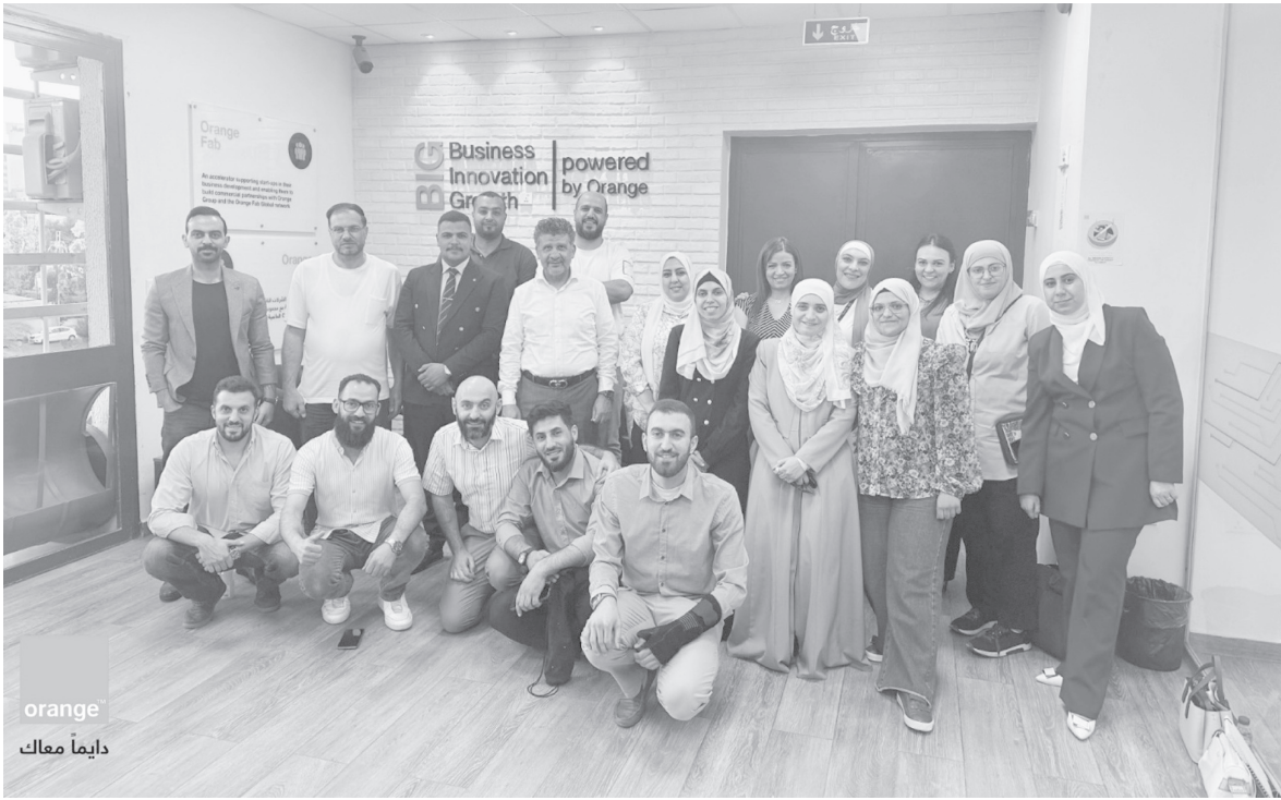
orange دائما معاك

الاتحادية للتعاون الاقتصادي والتنمية BMZ ، والهادفة إلى تمكين رؤاد الأعمال والشركات الناشئة والمشاريع الصغيرة والمتوسطة في الأردن عبر تعزيز معرفتهم المالية. ويستهدف البرنامج خمس محافظات رئيسية، وهي: عمان والزرقاء وإربد والكرك والعقبه، حيث سيقدم تدريبات متخصصة مصممة لتزويد المشاركين بالمهارات اللازمة لإدارة مواردهم