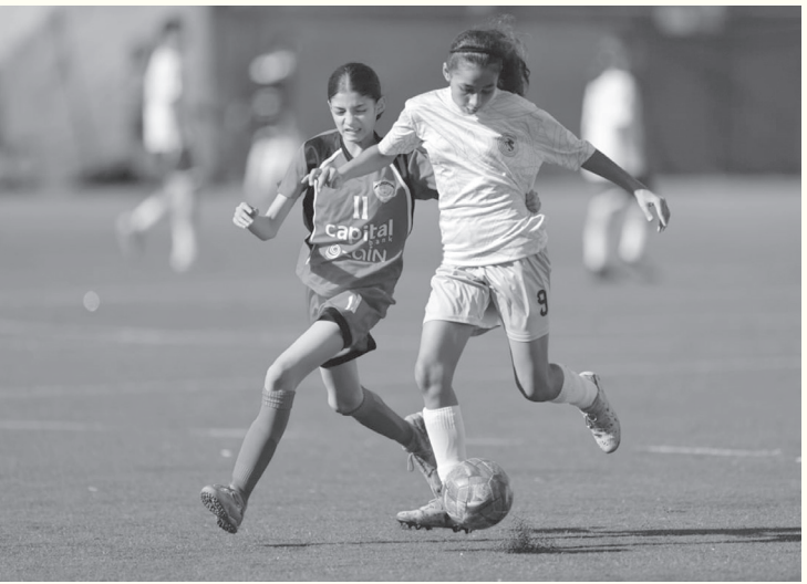
الأنياب - عمان

والأهلي ١٨، ثم المدرسة الإنجليزية الحديثة ١٦، والحسين ١١، تنشامي المستقبل ١٠، النصر ٨، الأروذكسي ونشمي الجنوب وأبطال الساحة الخضراء والاستقلال ٤، والكلية الرياضي (دون نقاط). وتنطلق منافسات الجولة الثامنة عند الخامسة مساء الثلاثاء المقبل، بمواجهة تنشامي المستقبل مع المدرسة الإنجليزية الحديثة، والأهلي مع نشمي الجنوب، وأبطال الساحة الخضراء مع النصر، والأروذكسي مع الاستقلال، فيما يلتقي عمان FC مع الاتحاد، والحسين مع الكلية الرياضي، عند السابعة مساء على ملاعب الاتحاد في مدينة الحسين للشباب.