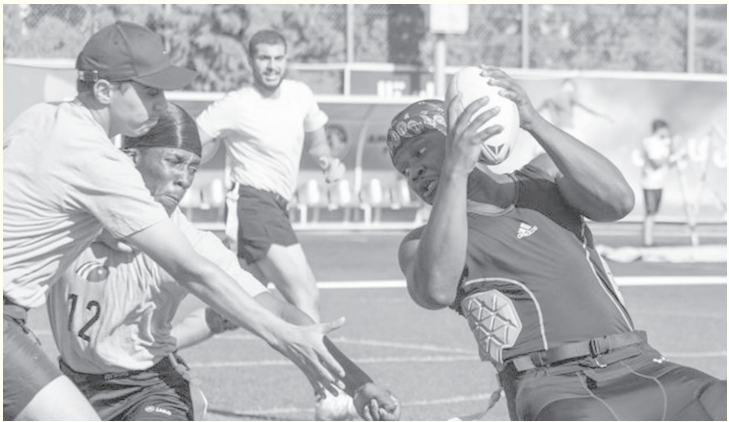
الأنياب - عمان

«دايستي» في المركز الثالث بعد تغلبه على فريق «فانتوم» بـ٣٣ دون رد، أما مباراة تحديد المركزين الخامس والسادس، فقد انتهت بفوز فريق المفرق على فريق «رايتورز» بنتيجة ٢١ مقابل ١٢.