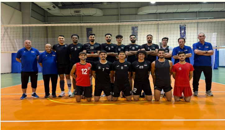
الأبطال - عمان

آسيا المقامة في البحرين. وبهذه الخسارة خرج المنتخب الوطني من المنافسة على اللقب، واكتفى بالمنافسة على المراكز من ٥ إلى ٨، فيما تأهل المنتخب السعودي إلى الدور نصف النهائي.