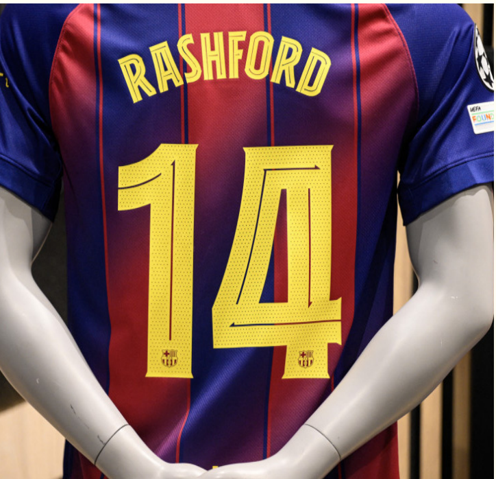
الأبطال - وكالات

إسبانيا هانزي فليك في أيار الماضي، راشفورد والجناح الكولومبي ليفيربول لويس دياس بأنهما «لاعبين رائعين»، وذلك في خضم أخبار الانتقالات التي كانت تربط فريقه بالتعاقد مع أحدهما لتدعيم مركز الجناح الأيسر. وتأنق الفريق الكاتالوني على الصعيد الهجومي الموسم الماضي وكان لا يُقاوم متوجاً ذلك بإحراز الثلاثية، لكنه افتقد إلى بدائل للاعب الجناح الأساسيين البرازيلي رافينيا ولامين جمال.