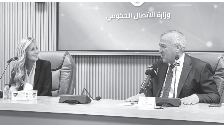
وزارة الاتصال الحكومي

نظّمت وزارة الاتصال الحكومي، أمس الأربعاء، ندوة تشقيفية حول التربية الإعلامية والمعلوماتية، شارك فيها عدد من موظفي وزارات، الأشغال العامة والإسكان، والنقل، والطاقة والثروة المعدنية، ضمن سلسلة ندوات تهدف إلى رفع مستوى الوعي الإعلامي لموظفي القطاع العام.