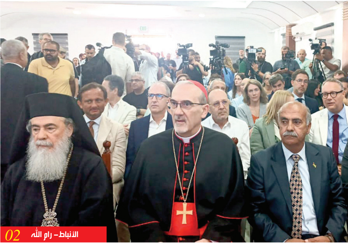
الأنباط- رام الله 02