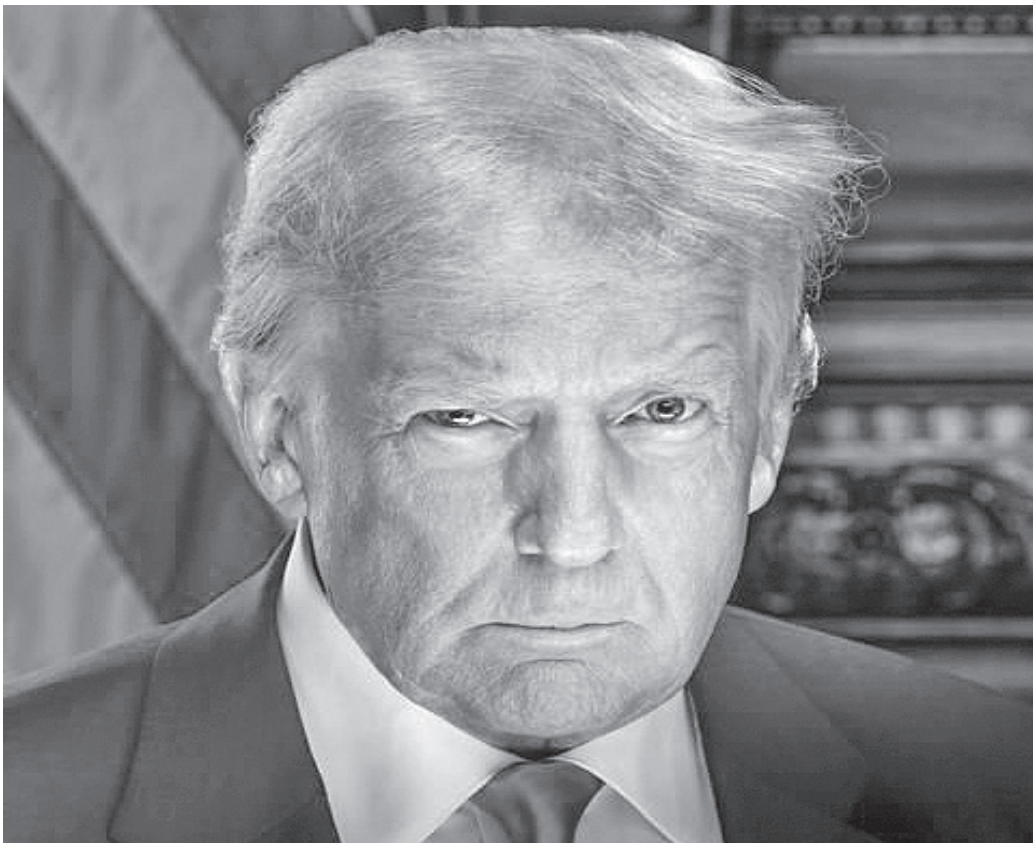
الأنباط – رزان السيد

منذ بدء ولايته الثانية في ٢٠ كانون الثاني (يناير) ٢٠٢٥ وحتى ١٣ تموز (يوليو) من العام ذاته، كرس الرئيس الأمريكي دونالد ترامب حضوره الرقمي كسلح سياسي وإعلامي لا يقل فاعلية عن خطابيه في البيت الأبيض.