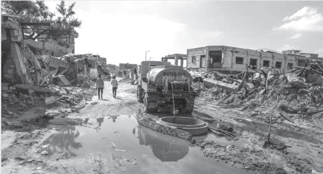
الأنباط - وكالات