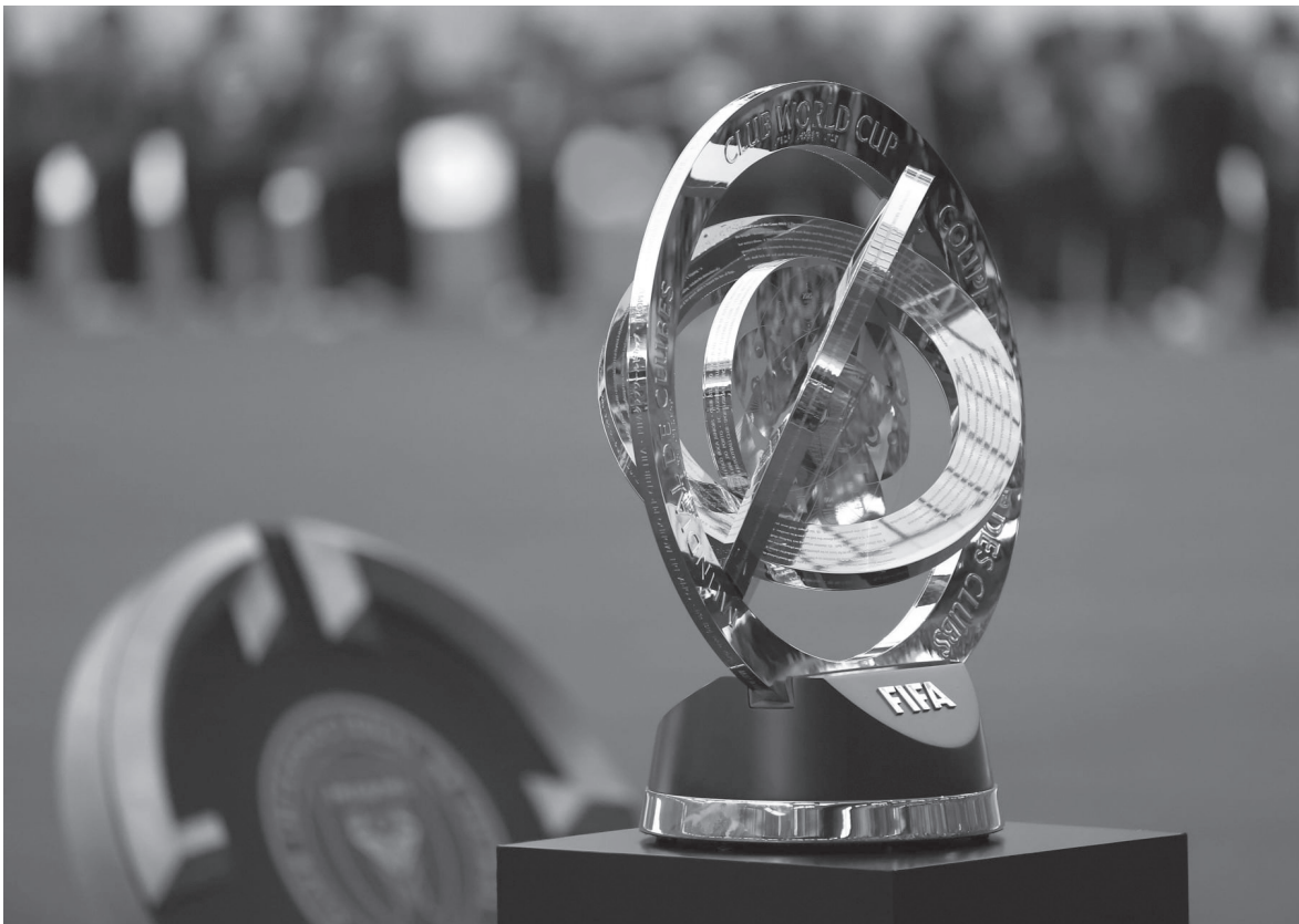
الأنباط - مينا بني ياسين

ذاتها في مباريات أخرى مثل أولسان هيونداي وماميلودي سنداونز في أورلاندو، ويوكا جونيورز ضد أوكلاند سيتي في ناشفيل، وسط تأخيرات فاقت أحيانا الساعة والنصف.