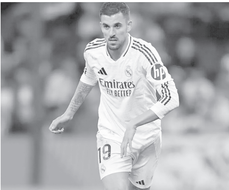
الأنباط - وكالات

ذلك، وهو ما أمل أن يكون قريبًا، سنتفق على ما يريده مني، وبعدها سنقرر ما هو الأفضل للنادي ولستقبلي».