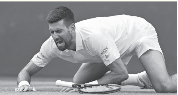
الأنباط - وكالات