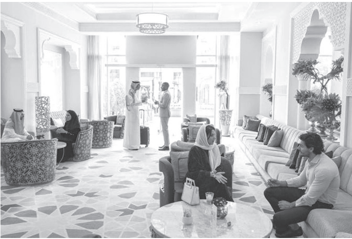
الأنباط - وكالات

الشرق الأوسط للفترة نفسها. وسجلت المملكة نموها في أعداد السياح الدوليين بنسبة 102% خلال الربع الأول من العام 2025م مقارنة بالفترة المماثلة من العام 2019م، متجاوزة معدل النمو العالمي 3% ومعدل نمو منطقة الشرق الأوسط 44%، مُعززة مكانتها الريادية في المشهد السياحي العالمي والإقليمي، نقلاً عن وكالة الأنباء السعودية -واس».