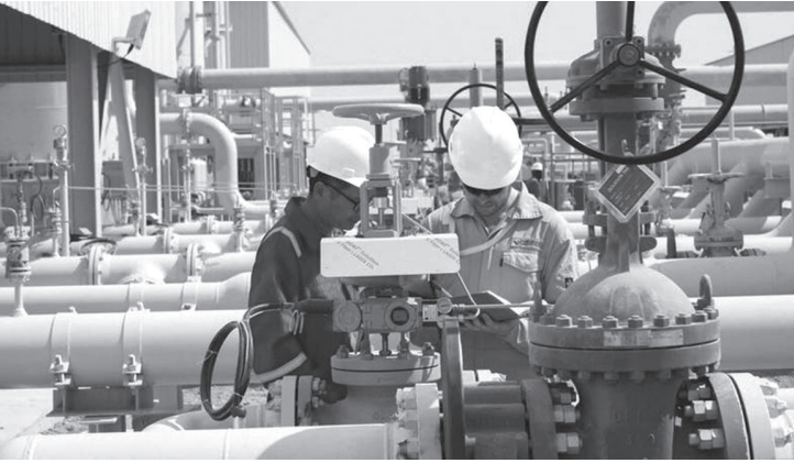
الأنباط - وكالات

تم تسعير خام البصرة المتوسط عند خصم يبلغ 0.55 دولار للبرميل دون سعر خام برنت المؤرخ، في تعديل عن التقديرات السابقة التي كانت تشير إلى خصم قدره 1.70 دولار.