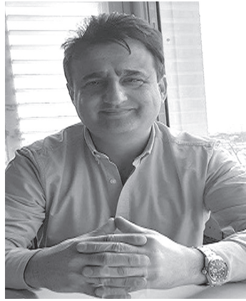
الأنباط - وكالات

وأوضح السقا أن هذا المؤتمر يجب ألا يكون فقط مناسبة لجمع التعهدات المالية، بل مناسبة لوضع خارطة طريق اقتصادية وتنموية وسياسية واضحة، تمتد لعشر سنوات، وتقوم على ثلاث ركائز أساسية: الإغاثة الفورية، والبناء المستدام، ومعالجة جذور الأزمة السياسية، بما يضمن عدم تكرار