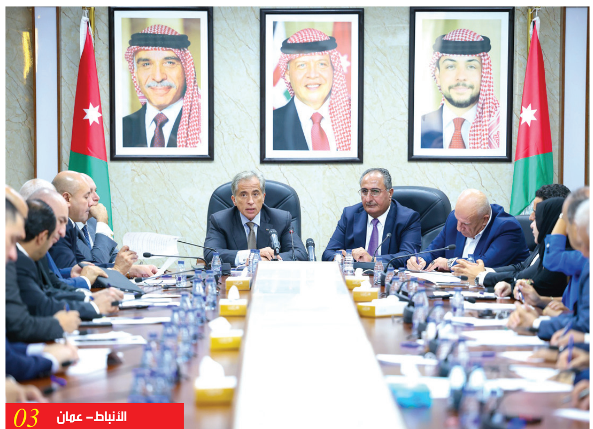
الانباط - عمان 03

رئيس الوزراء: الملف الاقتصادي هو الأهم بالنسبة للحكومة