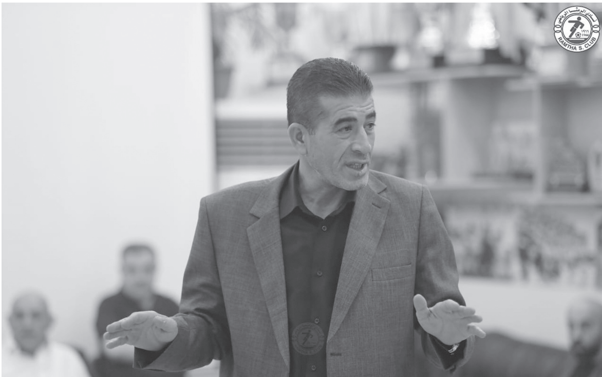
الأنباط - مينا بني ياسين

النظام بل أصبح مصدر دخل. وانتقد الزعبي العقوبة الأخيرة التي صدرت بحقه ويحق ناديه من لجنة الانضباط، مؤكداً أن السبب الرئيسي لها هو تجاوز سقف التعاقدات المالية، وقال: «هذا التجاوز موجود في أغلب الأندية، وليس نادي الرمثا وحده، منوها الى ان السقف المالي المحدد بـ ١٥٠ ألف دينار غير منطقي ولا يتناسب مع المصاريف الفعلية التي تتحملها الأندية خصوصاً في ظل حرمان الرمثا من تسجيل لاعبين بسبب تراكم الديون التي بلغت مليونين ومئتي ألف دينار، واصفاً إياها بـ«البلاء».