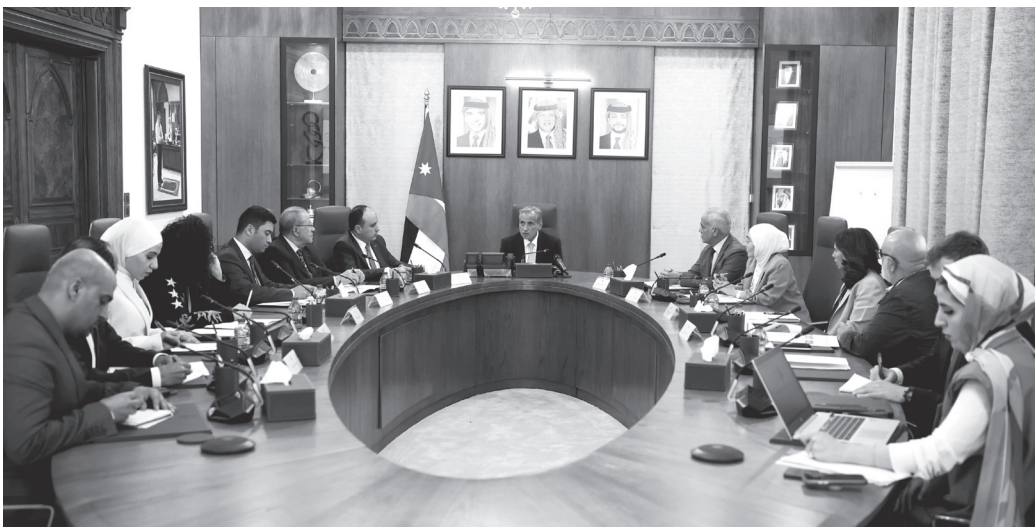
الانباط – عمان

أكد رئيس الوزراء الدكتور جعفر حسان أهمية مؤسسة جائزة الحسين بن عبدالله الثاني للعمل التطوعي، والتركيز على توسعة قاعدة المشاركين فيها على مستوى الأفراد والجهات على أن تشمل جميع محافظات المملكة. كما أكد رئيس الوزراء خلال ترؤسه اجتماعاً لمجلس أمناء الجائزة، أهمية تشجيع الشباب على العمل التطوعي ودعمه وتوسيع نطاقه نحو الأعمال التطوعية التي يحتاجها المجتمع في مختلف المجالات، مشدداً على ضرورة أن تكون مراكز الشباب في المحافظات حواصن للأعمال التطوعية وأن يكون العمل التطوعي جزءاً أساسياً من عملها.