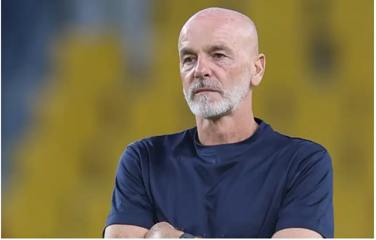
الرياض - وكالات

أعلن نادي النصر السعودي الأربعاء، رسمياً إنهاء عقده مع المدرب الإيطالي ستيفانو بيولي، بعد نهاية موسم لم يحقق خلاله الفريق تطلعات جماهيره على الصعيدين المحلي والقاري. وقال النادي في بيان مقتضب عبر حسابه الرسمي على منصة "إكس": "تعلن شركة نادي النصر رسمياً إنهاء العلاقة التعاقدية مع مدرب الفريق الأول السيد ستيفانو بيولي، مشمئنين له ولطاقمه الفني كافة الجهود التي بذلوها، ومتمنين لهم التوفيق". وكان بيولي ٥٩ عاماً، قد تولى تدريب النصر في بداية موسم ٢٠٢٤-٢٠٢٥، وقاد الفريق في ٤٤ مباراة بجميع البطولات، حقق خلالها ٢٨ انتصاراً، مقابل ٧ تعادلات و٩ هزائم. ورغم البدايات القوية، أنهى الفريق موسمه في المركز الثالث بدوري روشن السعودي، خلف الهلال والاتحاد، ليخسر فرصة التأهل إلى النسخة المقبلة من دوري أبطال آسيا للنخبة. كما ودّع النصر بطولة كأس الملك من دور ال١٦ أمام التعاون، وخرج من نصف نهائي دوري أبطال آسيا للنخبة أمام كاواساكي فرونتالي الياباني، ما ساهم في زيادة الضغوط على المدرب الإيطالي وإدارة النادي.