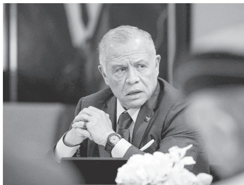
الانباط - عمان

التقى جلالة الملك عبدالله الثاني في قصر الحسينية، امس الثلاثاء، مجموعة من المتقاعدين العسكريين، وجرى بحث عدد من الملفات المحلية والإقليمية. ورحب جلالة الملك، خلال اللقاء، بجهود خفض التصعيد في الإقليم، بقيادة الولايات المتحدة الأمريكية، معربا عن تطلع الأردن للالتزام جميع الأطراف بالتمهدة وصولا إلى إعادة الأمن والاستقرار للمنطقة. وأعاد جلالة التأكيد على ضرورة تكثيف الجهود الدولية لوقف الحرب على غزة وضمان إيصال المساعدات الكافية، ووقف التصعيد الخطير في الضفة الغربية والقدس. ولفت جلالة الملك إلى أن الأردن مستمر بالتنسيق مع الدول الشقيقة والصديقة والأطراف الفاعلة للتوصل إلى تهدئة شاملة في الإقليم، مشددا على ضرورة احترام سيادة الدول والالتزام بالقانون الدولي. وأكد جلالة أن حماية مصالح الأردن والحفاظ