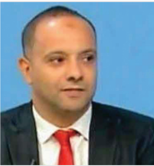
انقسام الداخل وتخاذل الخارج يطيل أمد الكارثة في غزة

أما الباحث في العلاقات الدولية، الدكتور عمرو حسين، فيضع أصبعه على جوهر التناقض القائم، موضحاً أن هناك فرقاً جوهرياً بين الحروب الإقليمية التي شهدت نهايات سياسية واضحة، وبين الحرب القائمة على غزة رغم هول الكارثة الإنسانية والميدانية.