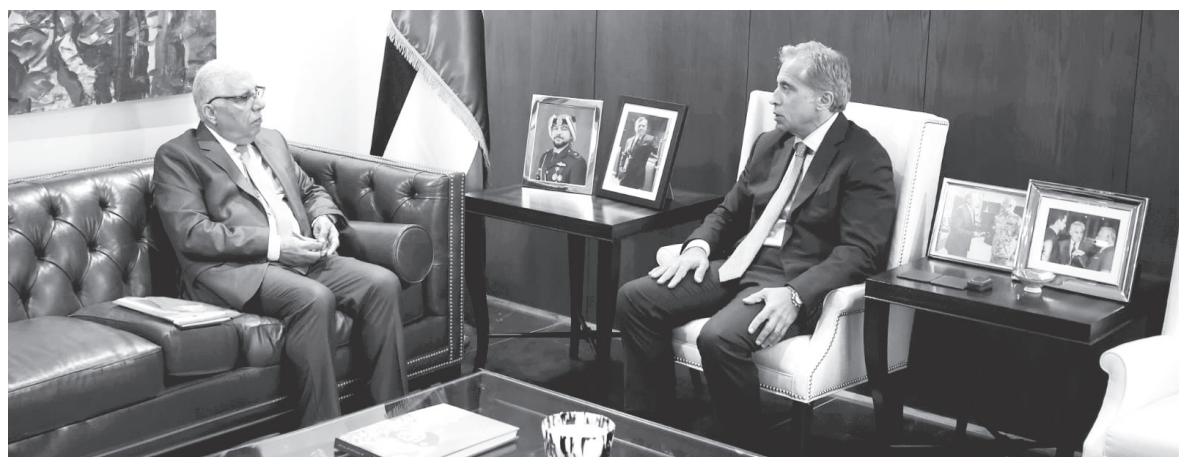
الإعلام الوطني في خدمة مشروع التحديث الشامل: السياسي والاقتصادي والإداري. وحضر اللقاءين وزير الاتصال الحكومي، الناطق الرسمي باسم الحكومة الدكتور محمد المومني.