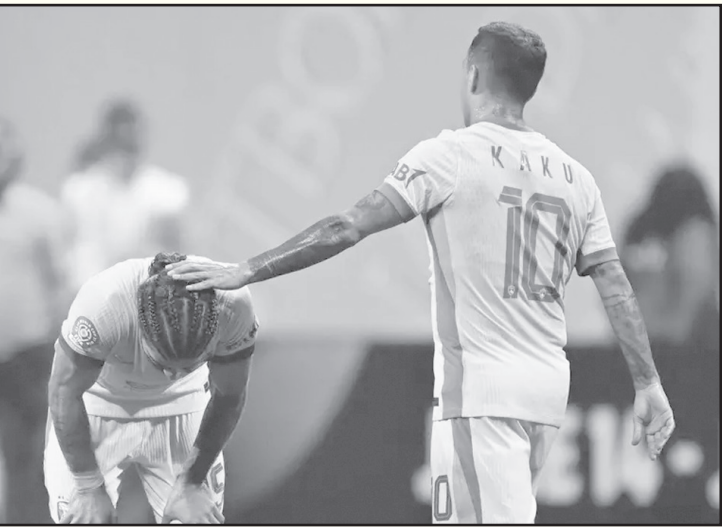
ميامي - وكالات

٥) لتصبحا أقل هزيمتين في سجل العادي عبر جميع السابقات. هذا النتائج التي تدرجاً حاداً للعين، الذي يعتبر الأكثر توثيقاً بالانقلاب في تاريخ القرن الإمبراطورية، لكنه عانى خلال الموسمين الآخرين من خسائر ثقيلة محلياً وقارياً. منها (٣-١) أمام الوصل والنصر، و-٢) (٤) أمام الوصل وجمعان في دوري أدنوك، إضافة إلى هزائم في دوري أبطال آسيا أمام باختاكور (٣-١)، النصر السعودي (٤-٣) و-١) الخرافة (٤-٢)، والهلal (٥-٤) وكأس القارات أمام الأمل العربي (٣-٠) ارتفع عدد الأهداف التي استقبلها العين هذا الموسم إلى ٧٧ هدفًا في ٤٤ مباراة، بعد ١٧٥ هدف لكل مباراة، من بينها ٢٦ هدفًا في ٢٦ مباراة بدوري أدنوك.