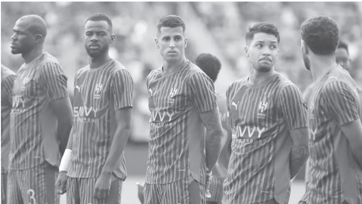
ميامي - وكالات

حفظ الهلال وجه ماء قارة آسيا في كأس العالم للأندية ٢٠٢٥، رغم فشله في تحقيق انتصار في نهائي الكورابان. وحقق الهلال قطعتين من أول مبارائين، حققه التعادل مع ريال مدريد ١-١ في الجولة الأولى، قبل التعادل سلبيا مع ريد بول سالزبورج بالجولة الثانية. يمتلك (العزم)، حظوظا في التأهل للدور النهائي، حيث يحتاج للفوز على باشوكا لكيسكي واختصار نتيجة مباراة ريال مدريد بـ سالزبورج يوم الجمعة المقبل. يأتي ذلك في الوقت الذي ودعت فيه كل الأندية الآسيوية كأس العالم من دور المجموعات بعد جولتين فقط، دون أن تحدد أي نقطة. ويتبدل أيضا رويد دامونزول بالياباني المجموعة الخامسة بعد فوز المونديال بل رصيد من النقاط، بعد فزيمتين من ريدر ليت وإنتر ميلان، حيث سجل هدفين واستقبل ٥. المجموعة السادسة يتبدلها أيضا فريق آسيوي، وهو أولسان هيونداي الكوري الجنوبي الذي ودع البطولة بل رصيد من النقاط، بعد فزيمتين ضد