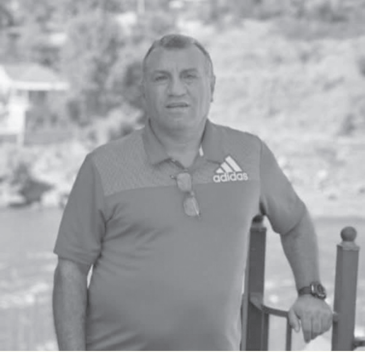
الانبساط - عمان

كأس آسيا في نسختي لبنان ٢٠٠٠ ومرة ٢٠١٠ التي أقيمت في اندونيسيا وماليزيا وفيتنام وتايلاند. وبعد اعتزاله واصف مشواره مع التحكيم باختياره محاضرا لدع لجنة الحكم في الاتحاد الاسيوي لكرة القدم مثلما عمل في مجالات التحكيم المحلية سنوات طوال... ونعت الاسرة الرياضية الفقيد عوني حسونه الذي تميزت مسيرته التحكيمية بالنزاهة والاداء.