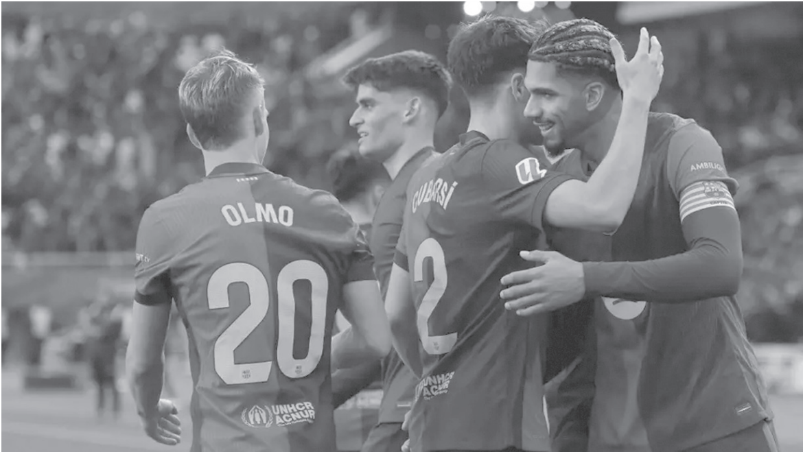
مدريد - وكالات

هزیمتین من یوفنتوس ومانشستر سیتی، وقد استقبل ۱۱ هدفا دون أن يسجل أي أهداف.