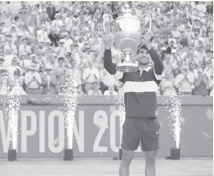
برلین - وکالات

بطولة كوينز بعد تنويجه بالنسخة السابقة عام ٢٠٢٣، بينما خاض ليهيشتكا أول نهائي له على الملاعب العشبية في مسيرته. وبات انكراز خامس لاعب نشط ينجح في التتويج بأربعة ألقاب على الأقل على الأراضي العشبية، بعد المصري نوحاك ديوكوفيتش (٨ ألقاب)، والإيطالي ماتييو بيريتيني (٤)، والأمريكي تالور فريتز (٤)، والفرنسي نيكولا ماهو (٤). كما واصل انكراز سلسلة انتصاراته المتتالية، التي ارتفعت إلى ١٨ فوزًا متتاليًا منذ بداية مشاركته في بطولة روما للأستاذة.