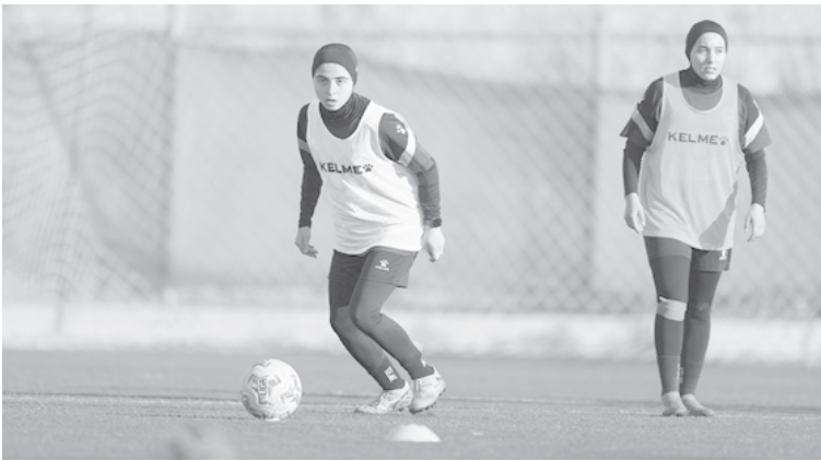
الانبط - عمان