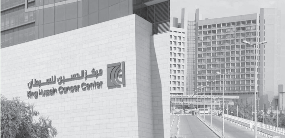
الأنباط- كارمن إين

من المرضى التي قد تصل نسبتهم إلى ٦٠٪، ومُحقَّقة نتائج إيجابية سيُلاحظ أثرها على المدى القريب.