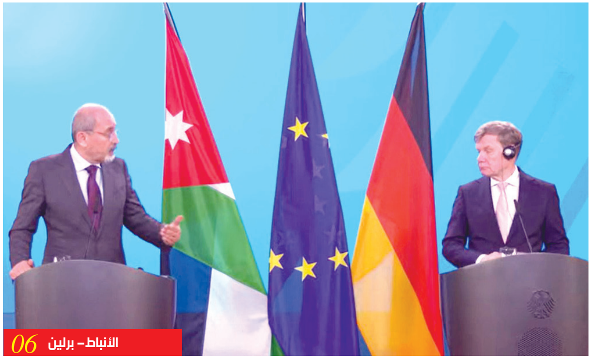
الأنباط – برلين 06

الأردن وألمانيا يؤكدان الشراكة الاستراتيجية ويدعوان إلى وقف التصعيد والعمل الدبلوماسي الصفدي: الحرب تدفع المنطقة إلى الهاوية والحل في الدبلوماسية