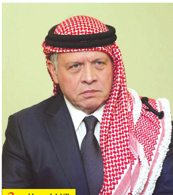
الأنباط - عمان 2

الملك يجدد التأكيد على موقف الأردن الثابت بأنه لن يكون ساحة حرب لأي صراع