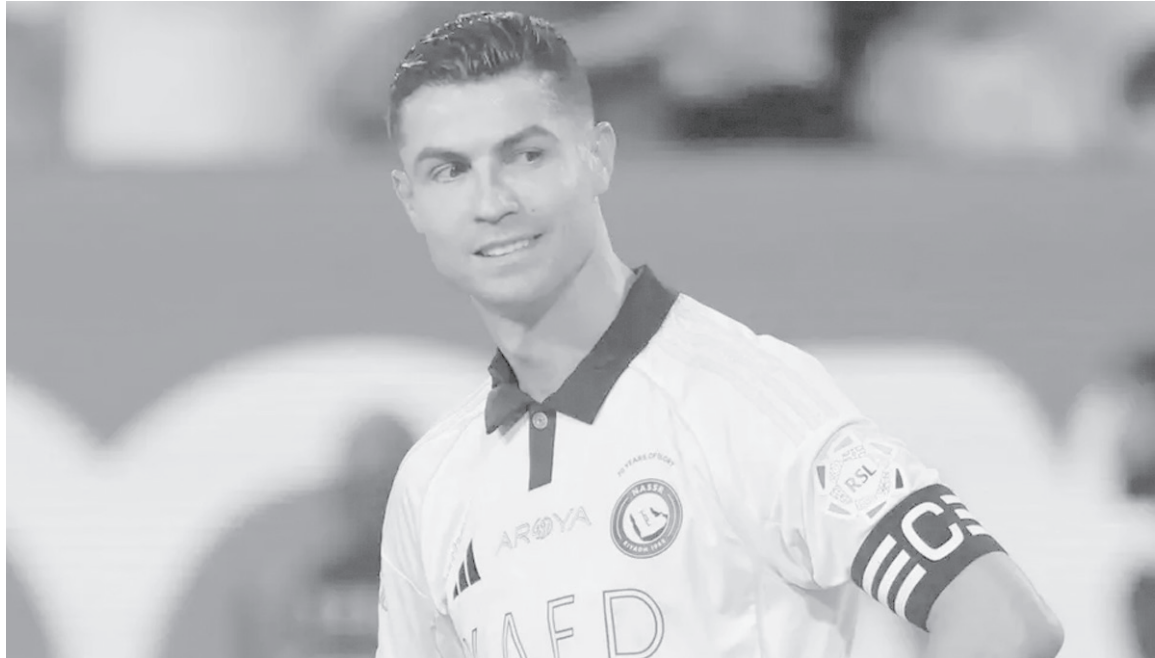
الرياض - وكالات

أفادت مصادر موثوقة أن نادي النصر السعودي، اقترب من حسم مستقبل نجمه البرتغالي كريستيانو رونالدو، قائد وهداف الفريق، الذي