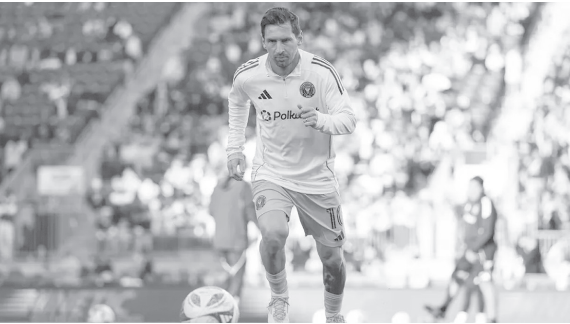
الرياض - وكالات

أكدت مصادر سعودية السيت، أن صندوق الاستثمارات العامة السعودي بدأ تحركات جديدة تهدف إلى التعاقد مع النجم الأرجنتيني ليونيل ميسي، قائد إنتر ميامي الأمريكي. ويرتبط ليونيل ميسي حالياً بعقد مع نادي إنتر ميامي الأمريكي حتى نهاية عام ٢٠٢٥، بعد انضمامه إليه في صيف ٢٠٢٣ قادماً من باريس سان جيرمان الفرنسي. وأوضحت المصادر، في تصريحات خاصة لكوورة، أنه قد جرى خلال الأيام الماضية عقد عدة اجتماعات بين ممثلين عن الصندوق ووكلاء ميسي، لمناقشة مدى إمكانية انتقاله إلى دوري روشن السعودي، في ظل استمرار الرغبة السعودية في استقطاب أبرز نجوم العالم. دعماً لمشروع تطوير الرياضة ضمن «رؤية ٢٠٣٠». وأفادت بأن صندوق الاستثمارات سيمتخ ميسي، في حال وافق على