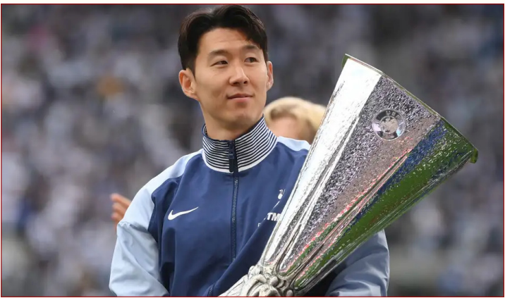
لندن

ضمن أولوياتها في الصيف الحالي، لكن النجم المصري فضل البقاء في الدوري الإنجليزي الممتاز ووقع على عقد جديد مع ليفربول بطل الدوري. هذا التحول جعل أنظار الأندية السعودية تنجّه نحو سون، الذي عانى هذا الموسم من الإصابات وابتعد عن مستوى المعروف، وفقا لما ذكرته «دا صن». ويظل النجم الكوري الجنوبي شخصية محبوبة بشدة في شمال لندن، رغم التراجع الواضح في مستوى هذا الموسم، حيث لم يسجل سوى ١١ هدفا في جميع المسابقات. وكان سون، البالغ من العمر ٣٢ عاماً، قد جدد عقده في يناير/كانون الثاني الماضي، ويُعتقد أنه سعيد بالبقاء مع الفريق، خاصة بعد توتنيج توتنهام بلقب الدوري الأوروبي وتأهله لدوري أبطال أوروبا الموسم المقبل.