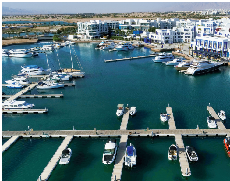
الأنباط - العقبة

تحتضن آيلة الشهر الحالي معرض مرسى آيلة للقوارب في نسخته الثالثة على التوالي، ويتضمن أحدث التطورات في قطاع الخدمات البحرية.