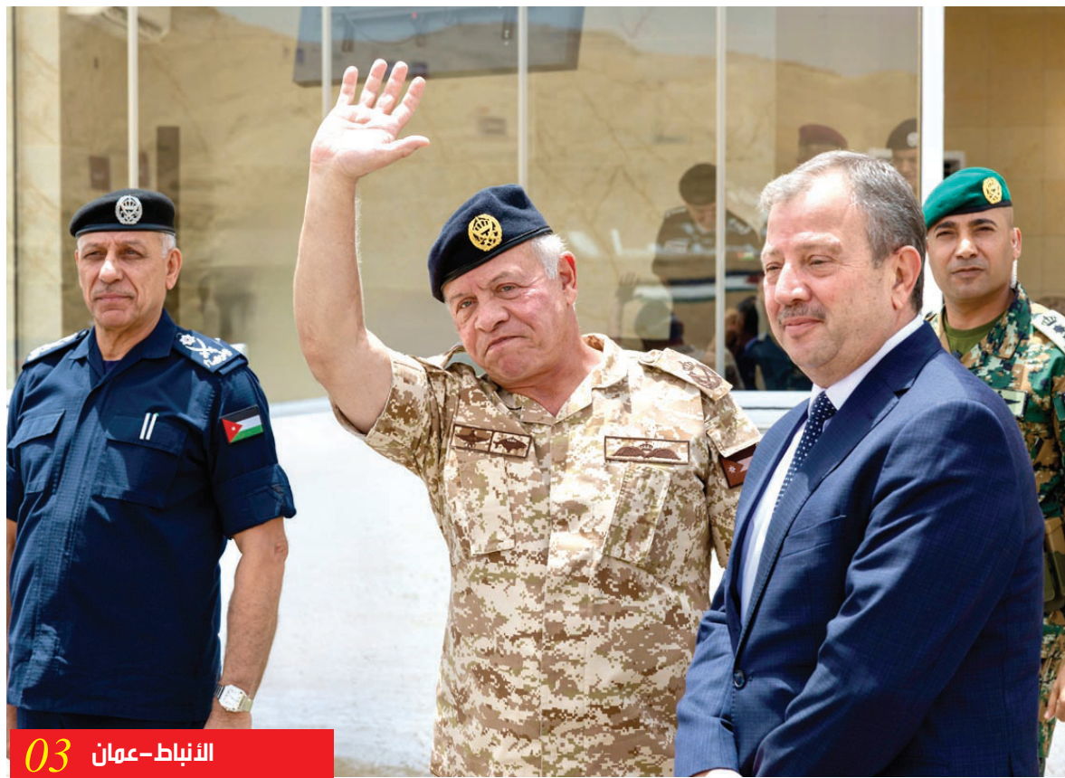
الأنباط - عمان 03