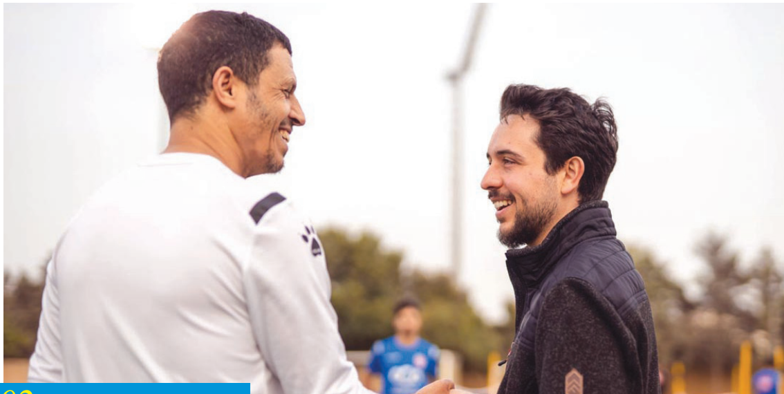
الأنباط - عمان 02

تفاعلات إقليمية متزايدة لكنها لا ترقى إلى مستوى مبادرة شاملة لحل جذري