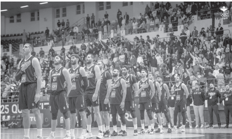
الانباط – عمان

أسفرت قرعة التصفيات الآسيوية المؤهلة إلى نهائيات كأس العالم لكرة السلة (قطر ٢٠٢٧)، والتي أجريت في العاصمة القطرية الدوحة، عن وقوع المنتخب الوطني ضمن المجموعة الثالثة، إلى جانب منتخبات إيران وسوريا والعراق وهي مجموعة متوازنة ومتاحة امام منتخبنا الوطني حيث سبق وان واجه الصقور تلك المنتخبات وسحل التفوق عليها في معظم المناسبات . وتنتطلق التصفيات في شهر تشرين الثاني (نوفمبر) من عام ٢٠٢٥، وتستمر حتى شهر آذار (مارس) من عام ٢٠٢٧، من خلال ست نوافذ تقام على مرحلتين.