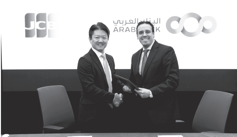
الأنباط – عمان

أطلق البنك العربي مؤخراً، بالتعاون مع شركة جي سي بي إنترناشونال (JCB International Co.)، الشركة العالمية التابعة لجي سي بي المحدودة (JCB Co.)، عمليات قبول الدفع ببطاقات جي سي بي JCB، التي يتم إصدارها في مختلف أرجاء العالم، لتشمل جميع أنحاء المملكة الأردنية الهاشمية.