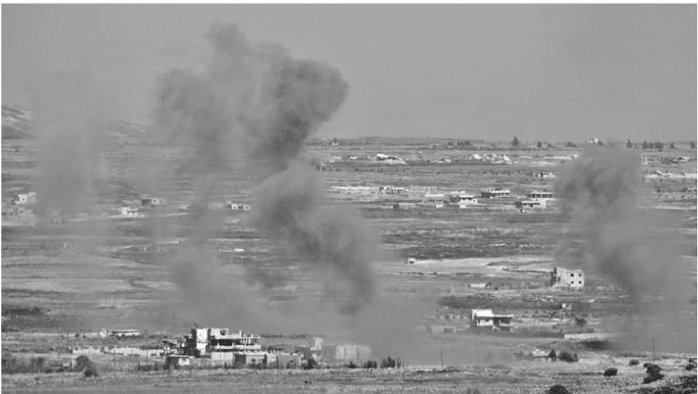
الأنباط – أيلاف الوهر

بينما يمدّ العالم يده للتعاون مع النظام السوري الجديد، يسعى الكيان الصهيوني إلى تكبير الأجواء عبر اللعب بورقة الاقليات وخاصة الدرّوز تارة، أو من خلال ضربات جوية للأراضي السورية أو توغل بري تارة أخرى، ما يفتح باب التساؤلات حول دوافع هذه التحركات وتأثيرها على الوضع في المنطقة.