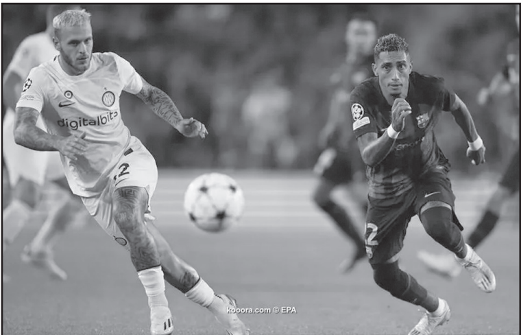
عواصم - وكالات

ربع النهائي بنتيجة إجمالية ٥-١، ليبلغ نصف النهائي لأول مرة منذ موسم ٢٠٠٨-٢٠٠٩. ويشهد اللقاء مواجهة إسبانية خارج الخطوط بين لويس إنريكي، مدرب سان جيرمان الذي توج بلقب الدوري الفرنسي مؤخرًا، وميكيل أرتيتا، المدير الفني لآرسنال الذي قاد فريقه لمسيرة شبه مثالية في البطولة. ورغم رحيل