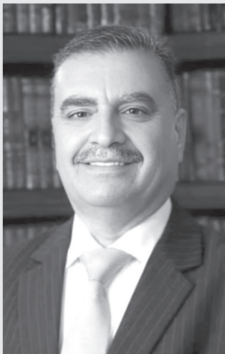
الأنباط - مناس بني ياسين

بينما يتسارع تغيّر المناخ عالمياً بوتيرة مقلقة، ويتزايد الضغط على الدول النامية لمواجهة هذا التحول البيئي الخطير، يسير الأردن بخطى مدروسة نحو بناء منظومة وطنية صلبة قادرة على مواجهة التحديات المناخية، إذ اعتمدت المملكة استراتيجيات وسياسات شاملة تركز على التكيف والتخفيف، وتعزيز مرونة القطاعات الحيوية مثل المياه، الزراعة، والطاقة، بدعم من تمويل دولي متنوع.