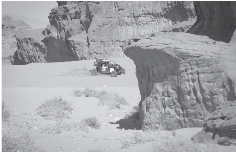
الانباط - عمان

دبليو باغي، وعامر عصيبي (فلسطين) وملاحه أسامة الباتل (فلسطين) على متن سيارة ميتسوبيشي باجيرو، وخالد تباها (فلسطين) وملاحه حسين القائد (فلسطين) على متن