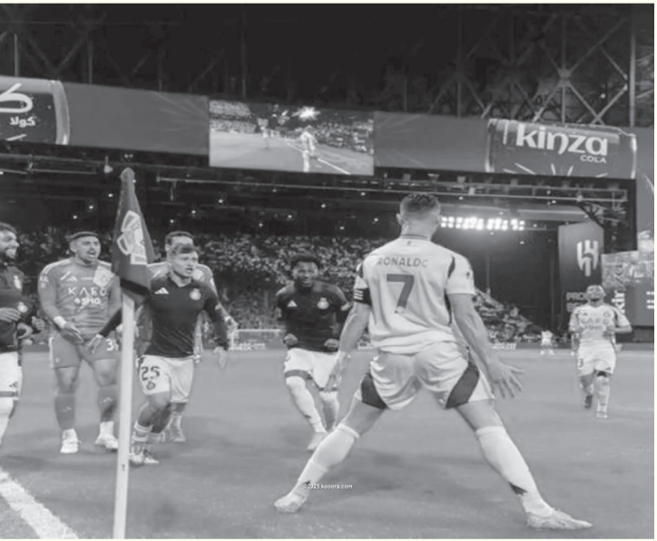
عواصم - وكالات

بتسجيل هدفين في فوز النصر أمام الهلال في ديربي العاصمة السعودية. وتشير الصحيفة إلى أن حال نجاح الفرنسي كريم بنزيمة في قيادة الاتحاد نحو الفوز أمام الأهلي فإن الفارق سيتسع مع الهلال الوصيف إلى ٧ نقاط، وسلطت إضاءة «توك سبورت» البريطانية، الضوء على وصول رونالدو إلى ٢١ هدفا في دوري روشن، حيث قالت: «كريستيانو يحقق إنجازا مجتونا (٢٠ هدفا أو أكثر خلال موسم واحد في بطولات الدوري للمرة الـ٥ في مسيرته».. وأشارت إلى أن «رونالدو لم يفشل في الوصول لهذا المعدل، سوى مرتين فقط على مدار ١٧ عاماً، ونشر الحساب الرسمي لشبكة «TNT Sports»، البرازيلية، تغريدة، مرفق بها صورة لرونالدو وجورجي جيسوس، مدرب الهلال، وعلق قائلاً: كريستيانو يبدع أمام السيد (جيسوس)، بعدما سجل هدفين في فوز النصر بديربي الرياض