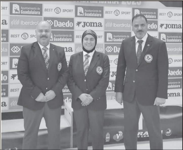
الانباط - عمان

البنّا. حيث شارك الحكام الأردنيون في إدارة مباريات البطولة التي تتميز بالقوة والندية والمنافسة. وجاءت مشاركة الحكام الأردنيين في هذه البطولة في ظل التميز الكبير الذي تشهده الكراتيه الأردنية على صعيد المنتخبات الوطنية والتحكيم، ما جعلها محط تقدير واحترام الاتحادين العالمي والآسيوي.