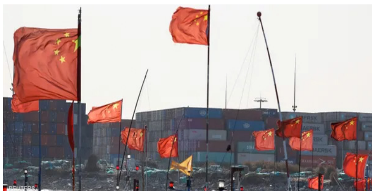
الأنباط - وكالات

أعلنت وكالة أنباء الصين الرسمية «شينخوا» أن بكين ستفرض رسوما جمركية بنسبة 34 بالمئة على جميع الواردات القادمة من الولايات المتحدة، وذلك بدءا من العاشر من أبريل الجاري. وتأتي هذه الخطوة في إطار الرد الصيني المباشر على إعلان الرئيس الأميركي دونالد ترامب فرض رسوم جمركية مماثلة بنسبة 34% على السلع الصينية. التفاصيل ص « ٣ »