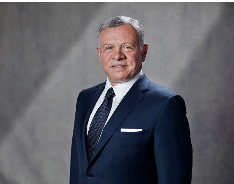
الأنباط - صوفيا

الملك والرئيس البلغاري يتراسان جولة جديدة من «اجتماعات العقبة» في صوفيا