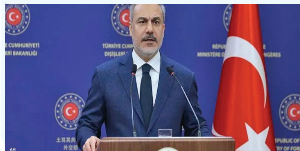
الأنباط - وكالات

قال وزير الخارجية التركي هاكان فيدان الجمعة، إن تركيا لا تريد أي مواجهة مع إسرائيل في سوريا. وذلك بعد أن قوضت الهجمات الإسرائيلية المتكررة على مواقع عسكرية هناك قدرة الحكومة السورية الجديدة على ردع التهديدات. وأضاف فيدان في مقابلة مع وكالة «رويترز» على هامش اجتماع وزراء خارجية دول حلف شمال الأطلسي في بروكسل، أن تصرفات إسرائيل في سوريا تمهد الطريق لعدم استقرار المنطقة في المستقبل.