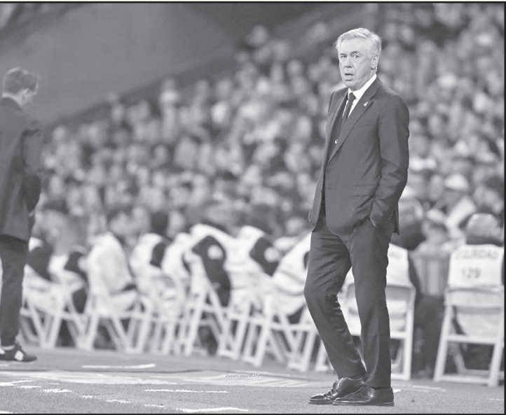
مدير - وكالات

الاحتيال على الخزنة بمبلغ يتجاوز مليون يورو. وعلى وجه التحديد، يواجه أنشيلوتي اتهامات بالاحتيال بمبلغ ١٠٦٠٠٧٩ يورو في العامين الماليين ٢٠١٤ (٣٨٦٠٣١١ يورو) و٢٠١٥ (٦٧٥٠٧١٨ يورو) أثناء فترته الأولى كمدير لريال مدريد. وشدد أنشيلوتي في أقواله 'لم أكن أدرك أبداً أن هناك شيئاً خاطئاً، ولم ألق أي اتصال يفيد بأن مكتب المدعي العام يحقق معي.. وأوضح 'كل شيء بدا لي صحيحاً، لم أعتقد أنه قد يكون هناك احتيالاً، ومع ذلك، بما أنني موجود هنا الآن، يبدو أن هناك شيء خاطئ، وأثنى الأمور لم تكن تجري بشكل صحيح كما كنت أتصور..'