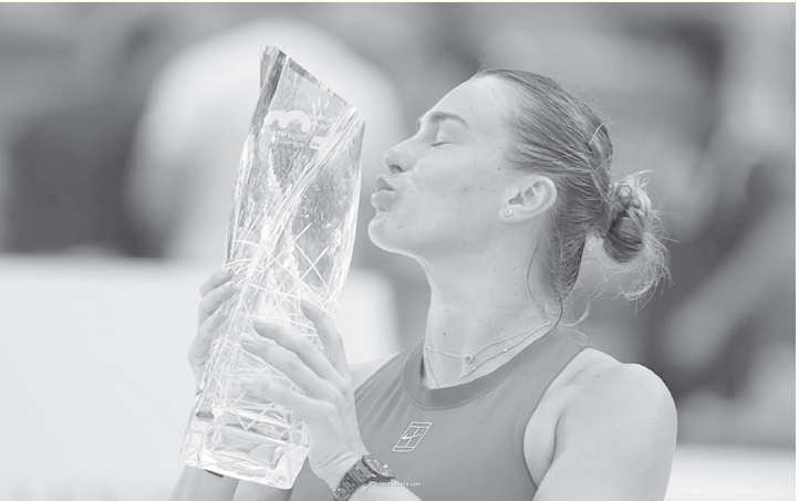
ميامي - وكالات

مسيرتها الاحترافية. وعززت سابالينكا تفوقها على بيجولا، الصنفة الرابعة عالمياً، بتحقيق انتصارها السابع أمامها، مقابل خسارتين فقط خلال ٩ مواجهات بينهما. كما عوضت خسارتها نهائي أستراليا المفتوحة، أمام ماديسون كيز، وسقطها أيضاً ضد ميرا أندريفا في إنديان ويلز. وبفوزها في ميامي للمرة الأولى، وسعت البيلاروسية الفارق إلى ٣٠٠٠ نقطة في صدارة التصنيف العالمي، مع البولندية إيجا شيفونتيك، التي ودعت البطولة من دور الثمانية أمام الفلبينية أنيس إايالا.