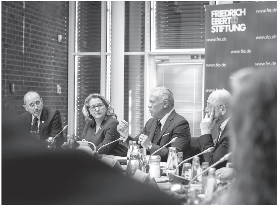
الأنباط - برلين

عقد جلالة الملك عبد الله الثاني، أمس الأربعاء، لقاء مع مسؤولين وبرلمانيين ألمانين وممثلي مراكز دراسات رفيعة في برلين. وتحدث جلالتة خلال اللقاء، الذي استضافته مؤسسة فريدريش إيبيرت الألمانية، عن مجمل التطورات في المنطقة، لا سيما الأوضاع الخطيرة في غزة والضفة الغربية، والتطورات في سوريا ولبنان. ودعا جلالة الملك إلى تكثيف الجهود الدولية لاستعادة وقف إطلاق النار في غزة، وإيجاد أفق سياسي لتحقيق السلام العادل والشامل على أساس حل الدولتين. وتم خلال اللقاء تبادل وجهات النظر حول الأحداث في الإقليم والعالم، وسبل تعزيز التعاون بين الأردن وألمانيا. وضم الحضور، ممثلين عن الاتحاد الديمقراطي المسيحي الألماني، والاتحاد الاجتماعي المسيحي، وتحالف ٩٠/حزب الخضر، وهي أحزاب حصلت على مقاعد في الانتخابات البرلمانية الأخيرة في ألمانيا.