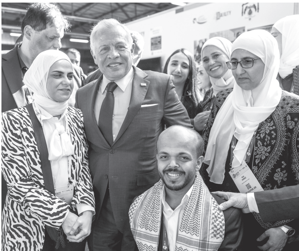
الأنباط - برلين

زار جلالة الملك عبد الله الثاني، أمس الأربعاء، جناح جمعية استعادة الأمل الأردنية المشاركة في القمة العالمية الثالثة للإعاقة في برلين. وانطلقت مبادرة استعادة الأمل العام الماضي بتوجيهات ملكية لدعم مبتوري الأطراف في غزة، إذ تم تركيب أطراف اصطناعية متطورة لأكثر من ٤١٥ شخصا تمكنوا من استخدام أطرافهم من جديد في غضون ساعات قصيرة. وبدأ تنفيذ المبادرة بالتعاون بين عدة جهات، شملت الخدمات الطبية الملكية والهيئة الخيرية الأردنية الهاشمية وشركة الحوسبة الصحية (حكيم). واستمع جلالتة إلى إيجاز من القائمين على الجمعية، بينوا فيه خطط توسيع أعمالها، وبناء الشراكات مع عدة دول، وتعزيز قدرات المختصين، خصوصا بعد تحويل المبادرة إلى مؤسسة غير ربحية تحت اسم (جمعية استعادة الأمل). واطلع جلالة الملك لدى زيارته جناح المجلس الأعلى لحقوق الأشخاص ذوي الإعاقة على دور المجلس في تعزيز حقوق الأشخاص ذوي الإعاقة بالملكة ومجهم في المجتمع، وجهود في المشاركة بتنظيم القمة ممثلا للأردن. وزار جلالتة معرض التكنولوجيا المساعدة، الذي يضم أحدث الابتكارات بمجال الأطراف الاصطناعية والمعينات السمعية، بحضور سمو الأمير مرعد بن رعد، كبير الأمناء في الديوان الملكي الهاشمي، رئيس المجلس الأعلى لحقوق الأشخاص ذوي الإعاقة.